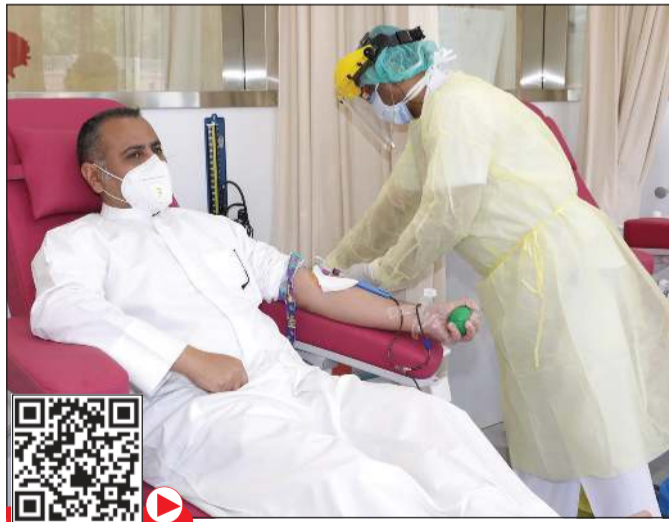
أحد المتبرعين خلال التبرع بالدم