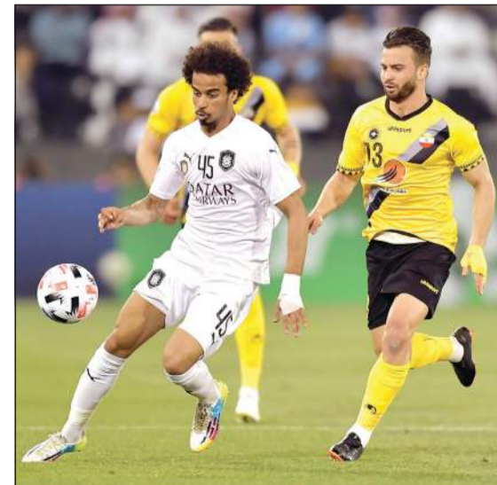
السد فتح ملف التعاقدات الجديدة

استئناف المسابقة بشكل رسمي، في الأسبوع الثاني من شهر سبتمبر. وعلى هذا النهج، بدأت إدارة نادي السد القطري في فتح ملف التعاقدات الجديدة بالمشاورة مع الجهاز الفني بقيادة الإسباني تشافي ميرنانديز لاختيار أفضل اللاعبين المقصدين الأجانب، لاسيما أن السد قرر في وقت سابق عدم تمديد عقد قائده الإسباني غايي فيرنانديز والذي يرغب في إعلان اعتزاله بنهاية الموسم الجاري من أجل تولي مهمة المدرب المساعد لناديه الأسبق أتلتيكو مدريد الإسباني الذي يقوده فنيا الأرجنتيني دييغو سيميوني، وكما تشافي يرغب في إيجاد بديل سوبر لمحترفه المكسيكي ماركو فابيان الذي لم يظهر بمستواه المعهود منذ انضمامه للسد في يناير الماضي.