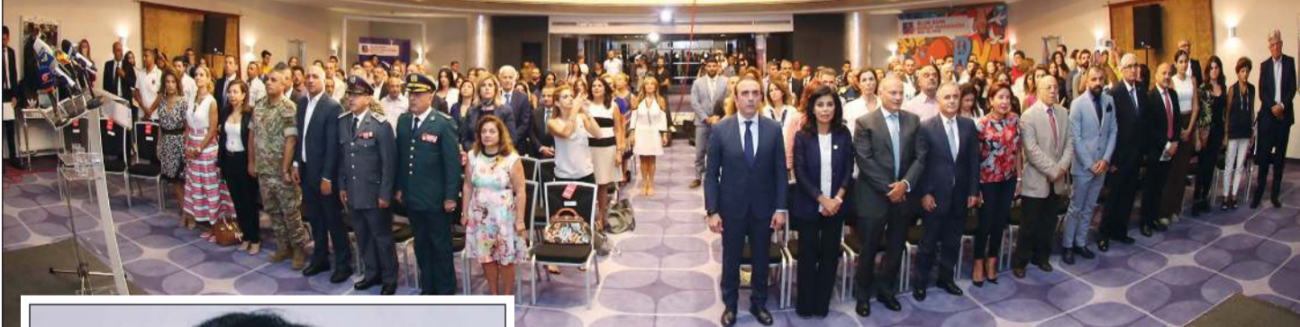
جانب من الحضور الكبير في إطلاق سباق بلوم بنك بيروت ماراثون 2019