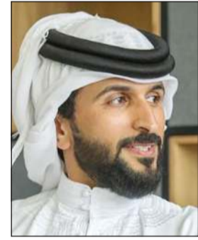
الشيخ ناصر بن حمد آل خليفة

حسم رئيس المجلس الأعلى للشباب والرياضة في البحرين الشيخ ناصر بن حمد آل خليفة، الجدل حول تحويل الأندية البحرينية إلى شركات تجارية، حيث شهد الشارع الرياضي البحريني في الفترة الماضية، تساؤلات عديدة حول هذا القرار، في ظل عدم استطاعة بعض الأندية التحول من ناد إلى شركة تجارية. وأكد بن حمد، أن هذا المشروع سيكون اختيارياً وليس إجبارياً، بناء على دراسة مقدمة من الأندية الرياضية، موضحاً أنه سيسهم في جعل البحرين تتجه إلى صناعة الرياضة وستفتح آفاقاً جديدة للأندية.