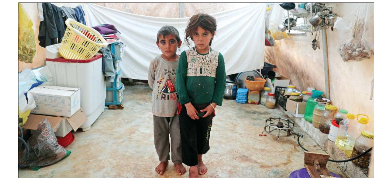
طفلان سوريان داخل خيمتهما في مخيم لاجئين قرب الحدود التركية حيث تعرضت المنطقة لمنخفض ادوى الى غرق عدة خيام

عمان - أ.ف.ب: لقي أربعة أطفال سوريين أشقاء حتفهم بعد اندلاع حريق في خيمتهم داخل إحدى المزارع جنوب عمان، على ما أفاد مصدر أممي أردني. وقال المتحدث باسم مديرية الأمن العام العقيد عامر السرطاوي في بيان إن «فرق الإطفاء والإسعاف في مديرية دفاع مدني غرب عمان تعاملت مع حريق نشب في ست خيم داخل إحدى المزارع الواقعة على طريق المطار (جنوب عمان)». وأوضح أنه «نتج عن الحريق وفاة أربعة أطفال أشقاء يحملون الجنسية السورية تبلغ أعمارهم عاماً وثلاثة أعوام وثمانية أعوام وعشرة أعوام إثر تعرضهم لحروق بالغة في الجسم». وأضاف أن «فرق الإطفاء قامت بإخماد الحريق، في حين عملت فرق الإسعاف على