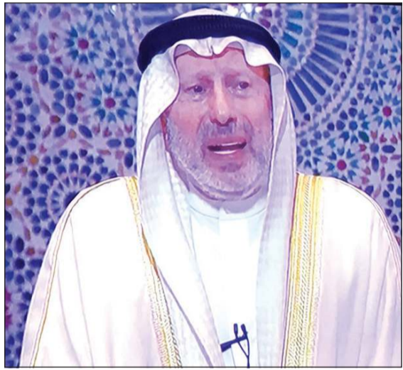
القارئ الشيخ أحمد الطرابلسي