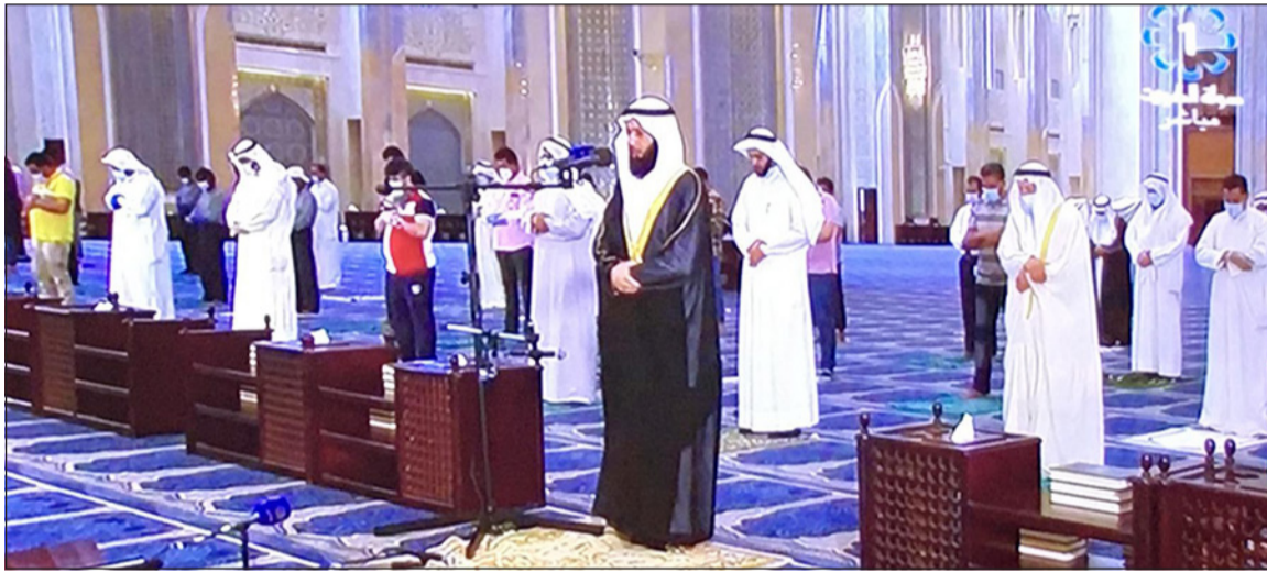
جانب من أداء صلاة الجمعة مع الحرص على التباعد الاجتماعي