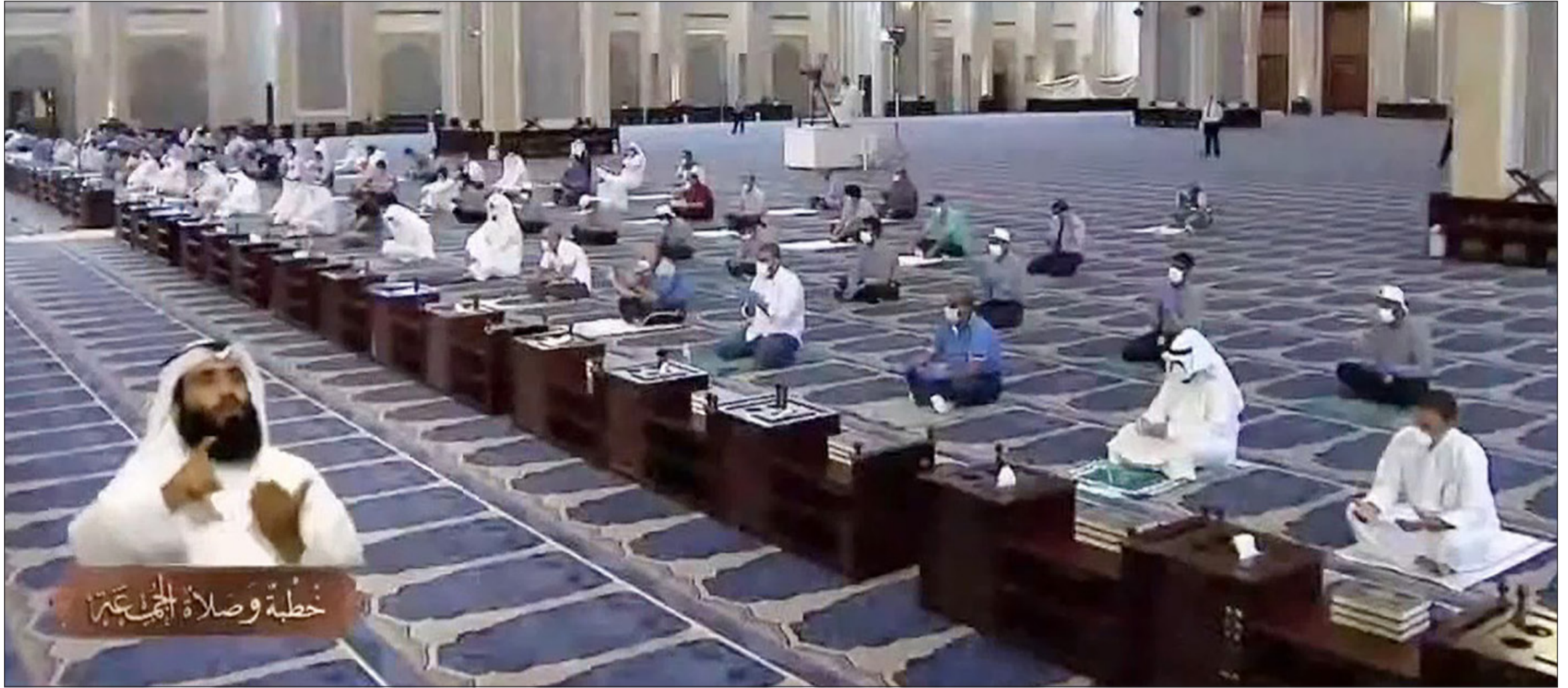
جانب من المصلين في المسجد الكبير خلال خطبة الجمعة