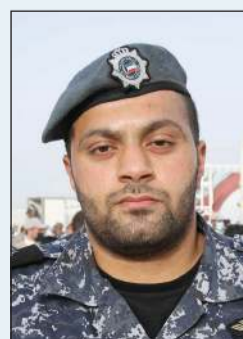
المقدم عبدالعزيز الأذينة

أوضح المقدم عبدالعزيز الأذينة من الإدارة العامة لقوات الأمن الخاصة في تصريح لـ «الأنباء»: «تقوم الإدارة العامة لقوات الأمن الخاصة في الفترة الحالية بتقديم المساعدة للجمعيات الخيرية في تأمين عملية توزيع السلال الغذائية على مستحقيها في المناطق المعزولة. وذكر الأذينة أن هناك أعداداً كبيرة من الأشخاص الذين يأتيون للحصول على المعونات بما قد يؤدي إلى حدوث تدافع وإزدحام وهنا يأتي دور رجال القوات الخاصة في تنظيم الأفراد في طوابير للحصول على السلة الغذائية بيسر وأمان. ووجه الأذينة رسالة للمواطنين والمقيمين في ظل أزمة فيروس كورونا المستجد - كوفيد 19 قائلاً: نتمنى من كل مواطن ومقيم الالتزام بكل الإجراءات الصحية والأمنية لسلامته وسلامة الآخرين حتى تنتهي هذه الأزمة بسلام».