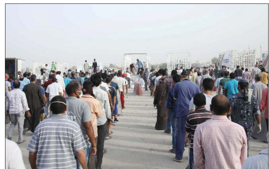
جانب من عملية توزيع السلال الغذائية على المعزولين في خيطان