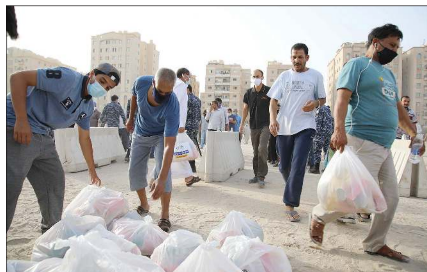
جانب من عملية التوزيع