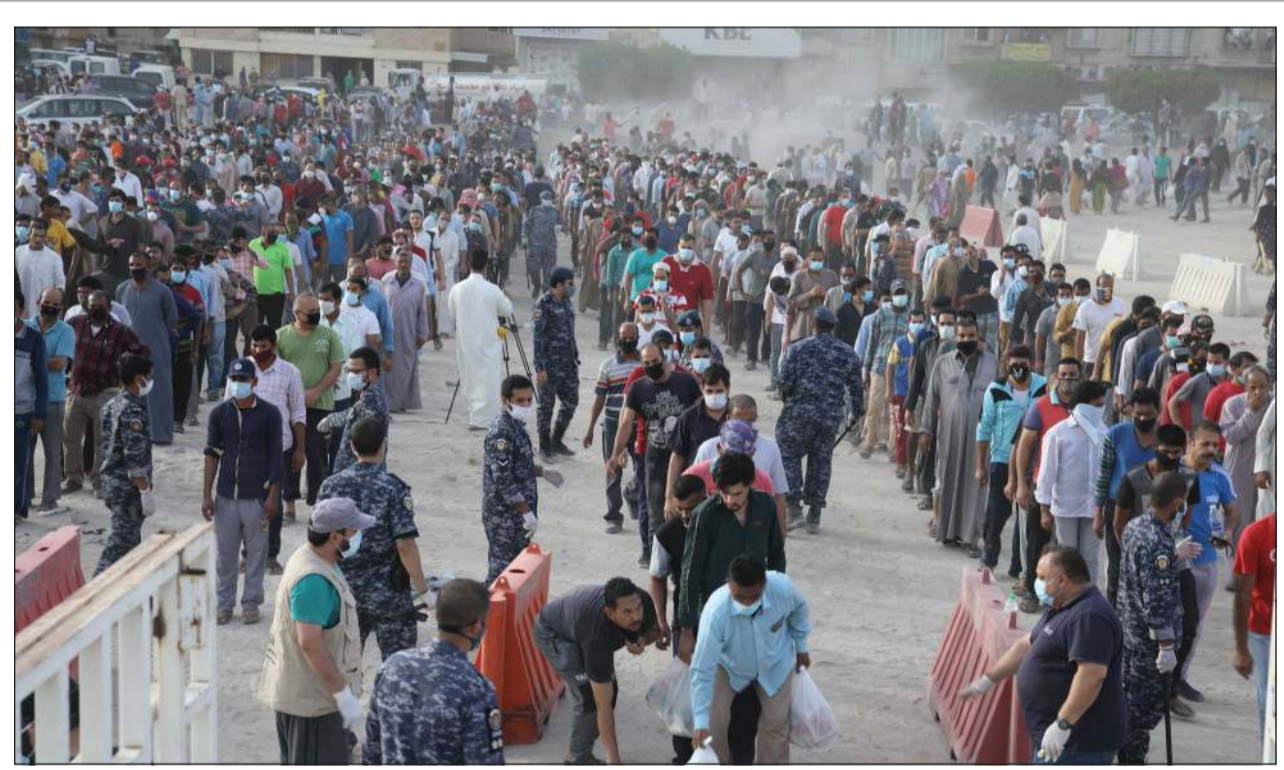
«الأنباء» رافقت جمعية النجاة الخيرية ورجال الدفاع المدني في توزيع آلاف المساعدات الغذائية على العمالة الوافدة في خيطان قبل ساعات من رفع العزل (رئيس كومار)