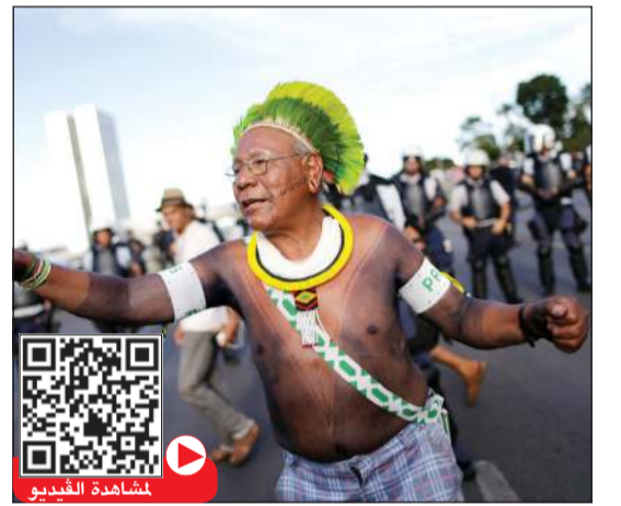
باياكان محتجا على سياسات رئيس البرازيل عام 2017

ريو دي جانيرو - أ.ف.ب: توفي بولينيو باياكان أحد أبرز المدافعين عن غابات الأمازون المطيرة وزعيم مجموعة من السكان الأصليين بعد إصابته بفيروس كورونا المستجد، وفق ما قال ناشطون الأربعاء.