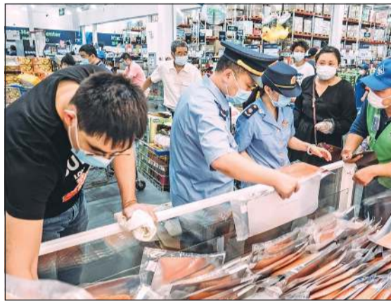
شراء السلمون انخفض بشدة بعد اتهامه بنقل كورونا

سمعة السلمون المطلخة لم تقتصر عليه بل امتدت إلى المأكولات البحرية الأخرى التي يقول أحد الباعة في سوق هذه الأغذية الرئيسية في المدينة أن مبيعاتها انخفضت بنسبة 80 بعد اتهام السلمون، ولكنه متفائل بعودتها إلى سابق عهدها خصوصا بعد أن أكدت السلطات الصحية أن السلمون لا يمكن أن يكون مستقبلا لفيروس كورونا.