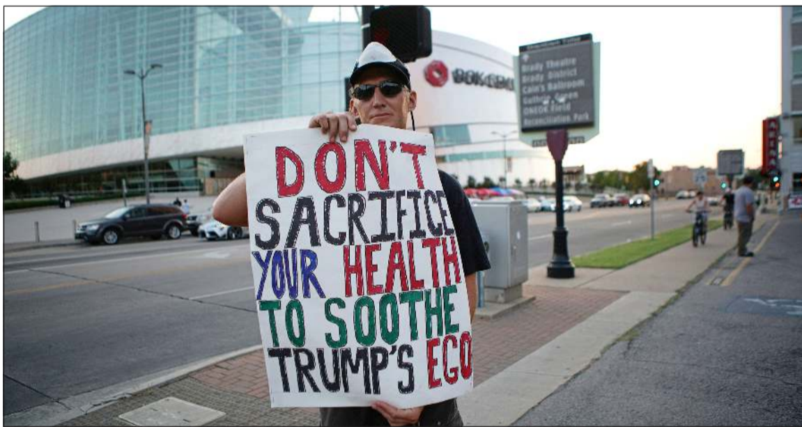
معارض لترامب يعتصم امام المركز الذي سيقم فيه مهرجانا انتخابيا مثيرا للجدل في تولسا بولاية أوكلاهوما (رويترز)

«لو لم ينشغل الديموقراطيون المؤيدون للمساءلة بقضية أوكرانيا في 2019، ولو أنهم استغلوا الوقت في التصفي بأسلوب أكثر منهجية في مسار ترامب في مجمل سياساته الخارجية، وربما جاءت نتيجة المسألة مختلفة تماما». لكن في المقابل فإن منتقدي بولتون يتهمونه بأنه أحجم عن الشهادة في استجواب مجلس النواب في وقت ربما كان حديثه فيه في غاية الأهمية. وربما كان غير مسار القضية. وشن النائب الديمقراطي آدم شيف، الذي قاد فريق الادعاء في قضية مساءلة الرئيس الجمهوري ترامب، هجوما على بولتون الذي هدد في ذلك الوقت بأنه «سيقيم دعوى قضائية إذا استدعي للمثول أمام لجنة التحقيق». وقال شيف في حسابه على تويتر: «لقد فضل الاحتفاظ بالمعلومات من أجل كتاب.. بولتون ربما كان مؤلغا، لكنه يفتقر للحس الوطني». غير أن كتاب بولتون يقدم نريجة جديدة لمنتقدي ترامب قبل انتخابات الرئاسة المقررة في الثالث من نوفمبر، بما في ذلك حوارات منسوبة لترامب مع الرئيس الصيني تطرقت في إحدى المرات لموضوع الانتخابات الأميركية. وفي أشد تصوير مرحج لإدارة ترامب من جانب