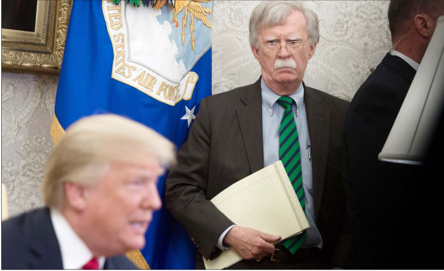
الرئيس دونالد ترامب ومستشاره للأمن القومي جون بولتون عندما كانا في فريق واحد

وأكد بولتون: أنه «من المحتمل أن يتمكن الرئيس (ترامب) من إجراء صفقات جيدة عندما يتعلق الأمر بالعقارات في مانهاتن. لكن إجراء صفقات لخفض الأسلحة الاستراتيجية، وفي العديد من القضايا الأخرى المتعلقة بالأمن الدولي، بعيدة جدا عن خبرات حياتته وتجاربه». وأضاف: «عندما يصادف شخصا مثل بوتن، نذير حياته وجهده لتحديد الموقف الاستراتيجي لروسيا في العالم، ثم بالمقارنة مع دونالد ترامب، الذي لا يحب القراءة عن ذلك والتعمق في هذه القضايا، فإن أميركا تجد نفسها في أصعب وضع وأحرج موقف» حسبما قال بولتون. وردا على سؤال محاوره الصحفي حول كيفية وصفه للعلاقة بين الرئيس الروسي والأميركي؟، قال بولتون: «اعتقد أن بوتن ذكي وصارم. اعتقد أنه يفهم أنه ليس لديه منافس جيد. لا اعتقد أنه قلق بشأن دونالد ترامب». وقد وزارة العدل الأميركية، بصفتها تمثل الادعاء العام، دعوى قضائية ضد بولتون على خلفية النشر المرتقب لمذكراته. تنهم فيها السلطات الأميركية بولتون بانتهاك التزامات عدم الكشف عن المعلومات التي تشكل أسرار الدولة، والتي تعهد بها، عند تعيينه مساعدا لرئيس الدولة.