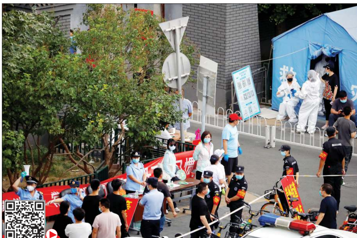
صغوف بشرية لاخذ عينات لعمل المسحة لتحليل فيروس كورونا في بكين

بأسين عبدالوارث بأعراض فيروس كورونا المستجد. وأكدت مكتب منظمة الصحة العالمية في اليمن، وفاة د.عبدالوارث، بعد إصابته بكورونا أثناء عمله في الميدان، أمس. كما أعلنت وزيرة الصحة الفلسطينية دخول دولة فلسطين في موجة ثانية من جائحة «كورونا المستجد». وشهدت الكلية، في بيان أوردته وكالة الأنباء الفلسطينية «وفا»، على أهمية وضرورة تقيد جميع المواطنين بإجراءات السلامة والوقاية. وقال المكتب في بيان: «لا داعي للقلق.. إنه حاليا في عزل ذاتي»، ولا يزال نزارباييف «78 عاما»، يتمتع بسلطة واسعة في الجمهورية الواقعة في آسيا الوسطى، والتي قادها منذ انتقالها إلى الاستقلال عن الاتحاد السوفيتي، وخلفه في الرئاسة العام الماضي الديبيلوماسي قاسم جومارت توكايف. وتترأس نازارباييف مجلس الأمن الكازاخستاني، ولا يزال يحتفظ بنفوذ في الساحة السياسية. وتم العام الماضي تسمية العاصمة الكازاخستانية باسمه «نور سلطان».