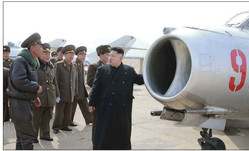
صورة ارشيفية لرئيس كوريا الشمالية كيم جونغ أون

الساحل الشرقي في كوريا الشمالية، حيث يعتقد أن بيونغ يانغ تبني غواصة جديدة قد تكون قادرة على حمل 3 صواريخ باليستية. من جانب آخر، حذر وزير الدفاع الكوري الجنوبي جيونغ كيونغ - دو أمس، من أن بلاده «سترد بقوة دون تردد» إذا قامت كوريا الشمالية بـ «استفزازات عسكرية» وسط تصاعد التوترات في شبه الجزيرة الكورية. ونقلت وكالة «يونهاب» الكورية الجنوبية للأنباء