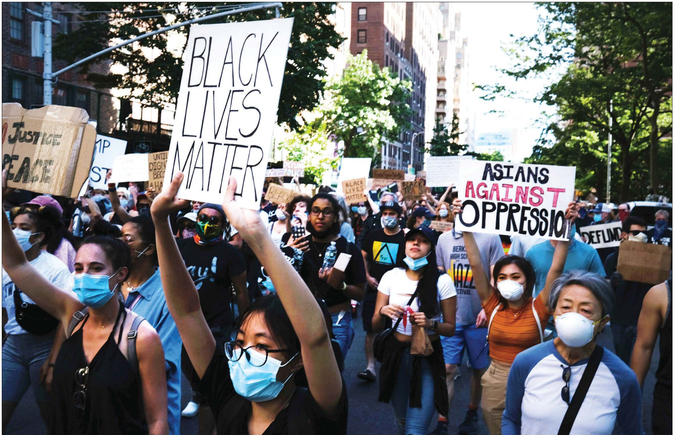
مظاهرون يحتجون ضد التمييز العنصري في نيويورك