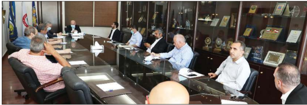
جانب من لقاء ممثلي الاندية مع اتحاد الكرة اللبناني