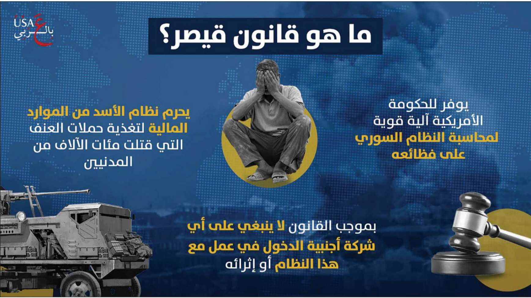
إنفوغراف نشرته الخارجية الأميركية تزامناً مع دخول قانون قيصر حيز التنفيذ

ومع تدهور الأوضاع الاقتصادية والارتفاع الهستيرتي في الأسعار، تظهر أيضاً إمكانية حدوث موجة جديدة من الاضطرابات. فقد تجددت تلك المظاهرات على مدى أكثر من أسبوع في السويداء، وكانت المدينة التي تسكنها أغلبية من الأقلية الدرزية من المناطق الخاضعة لسيطرة الحكومة التي لم تشهد انتفاضة على الأسد في 2011.