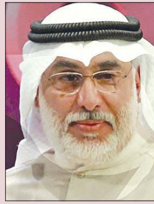
المخرج عبدالله عبدالرسول