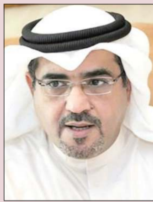
الإعلامي سعد الفندي