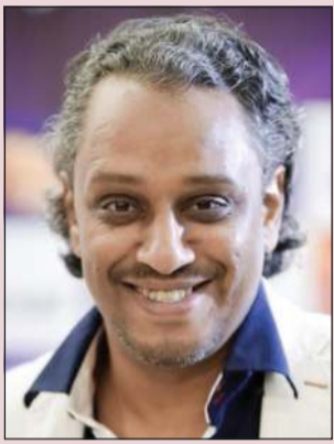
المخرج البحريني خالد الرويعي