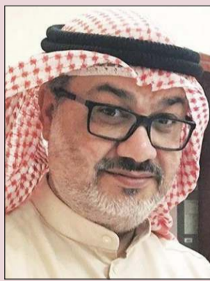
المخرج حسين المغدي