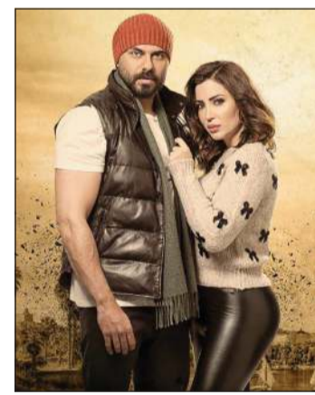
مسلسل «ختم النمر»