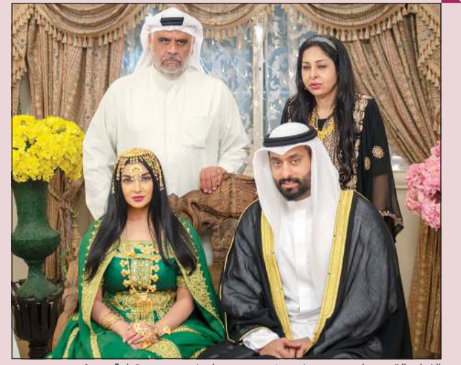
الفنان القدير داود حسين في مشهد من مسلسل «موضي قطعة من ذهب»

أكد أن الحجر المنزلي بالنسبة له أمر طبيعي خصوصاً أنه «بيتوتي» بطبعه