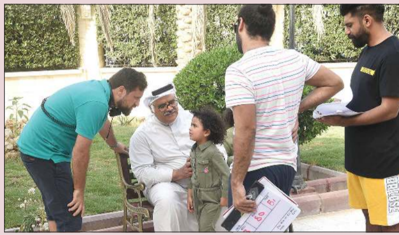
بوحسين أثناء تصوير «عبرة شارع»

أما عن تقديم البرامج التلفزيونية، وسبب الاستعانة به، فقال الفنان القدير داود حسين: تم استقطابي لتقديم البرامج بسبب جماهيري، بالإضافة إلى أنني كمتل كوميدي أستطيع أن أكون أكثر مرونة في إدارة الحوار، مردفاً: «طالما عندي مقدرة أن أقدم برامج فلا بد أن أظهرها.. ليش أخيبها؟»، لافتاً إلى أنه قدم برامج كثيرة ناجحة في الكويت والخليج، مؤكداً أنه لا يحب تقديم البرامج السياسية، ولكن إذا جاءه برنامج منوعات فيه أفكار جديدة فسيقبل به.