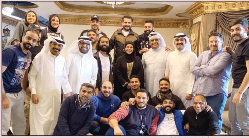
.. ويتوسط فريق مسلسل «في ذاكرة الظل»