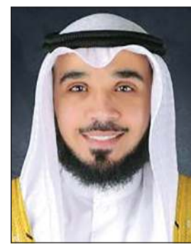
الشيخ خالد الخالدي