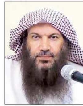
الشيخ سالم الطويل