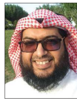
الشيخ فواز البرازي