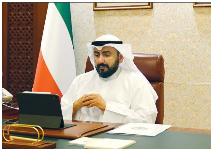
الشيخ د. باسل الصباح خلال الاجتماع

تم بحث مجلس الوزراء الشؤون السياسية في ضوء آخر التطورات الراهنة على الساحتين العربية والدولية، وبهذا الصدد أعرب مجلس الوزراء عن إدانته واستنكاره الشديد لهجوم الميليشيات الحوثية الإرهابية على مدينتي نجران وخميس مشيط بالمملكة العربية السعودية مؤخرًا، مؤكداً أن هذا الاعتداء الإرهابي الذي يستهدف أمن المملكة يعكس تخذت الميليشيات الحوثية على إجهاض كل فرص ومساعي السلام في المنطقة، كما يؤكد وقوف الكويت مع شقيقتها المملكة في كل ما تتخذه من إجراءات للحفاظ على أمنها واستقرارها. كما عبر مجلس الوزراء عن إدانته للهجوم الإرهابي الذي وقع في محافظة ديالى بجمهورية العراق مؤخرًا والذي أسفر عن مقتل وإصابة العشرات من قوات الأمن والمدنيين الأبرياء، مؤكداً على موقف الكويت الثابت والرافض لكافة أعمال العنف والإرهاب والتي تستهدف المدنيين الأبرياء وزعزعة الأمن والاستقرار. هذا، وقد عبر مجلس الوزراء عن تهنئته لجلالة الملك محمد السادس - ملك المملكة المغربية الشقيقة بعد نجاح العملية الجراحية التي أجريت لجلالته، سائلًا المولى عز وجل أن يحيطه بكرم عنايته ويديم عليه الصحة والعافية لمواصلة عطائه المعهود في خدمة بلده وأمنه.