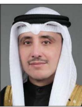
الشيخ أحمد ناصر المحمد

تلقى وزير الخارجية الشيخ د. أحمد ناصر المحمد اتصالاً مرثياً من وزيرة خارجية جمهورية كينيا الصديقة راشيل أوور أوامو قدمت خلاله شرحاً لأخر التطورات المتعلقة بترشح بلادها لعضوية غير دائمة في مجلس الأمن لعامي 2021 و2022.