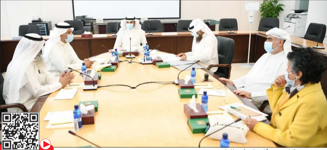
الرئيس مرزوق الغانم مقرئاً اجتماع مكتب المجلس

وفي ختام تصريحه، قال الغانم «الترتيب والأولويات والتصويت على العديد من الطلبات وطريقة ترتيبها موجودة في جدول أعمال المجلس وأي تغيير آخر يكون بقرار من المجلس أثناء الجلسة».