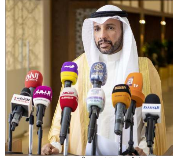
رئيس مجلس الأمة مرزوق الغانم متحدثاً