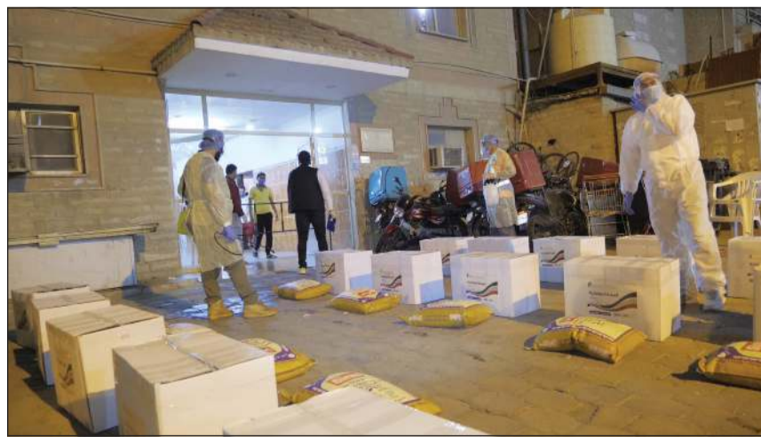
السللة الغذائية الواحدة تحتوي على مواد تموينية أساسية تكفي 6 أفراد لمدة شهر

قطعة من الفرش الإسفنجية والمخدات والشراشف والألحقة لمراكز الإيواء التابعة لوزارة الداخلية و1500 قطعة أخرى من المفروشات لزوم تجهيز المستشفى الميداني بمنطقة جيب الشيوخ للكوادر الطبية، و100 سرير، و100 شاشة تلفزيون و12 استناد للشاشات وغيرها من مستلزمات المستشفى. وأعرب المعتوق عن الشكر والتقدير للهيئة العامة للمعلومات المدنية لاستجابتها للهيئة الخيرية وتوفير قاعدة بيانات الأفراد المستفيدين الذي اعتمد عليه برنامج وزارة الشؤون في توزيع السلال الغذائية.