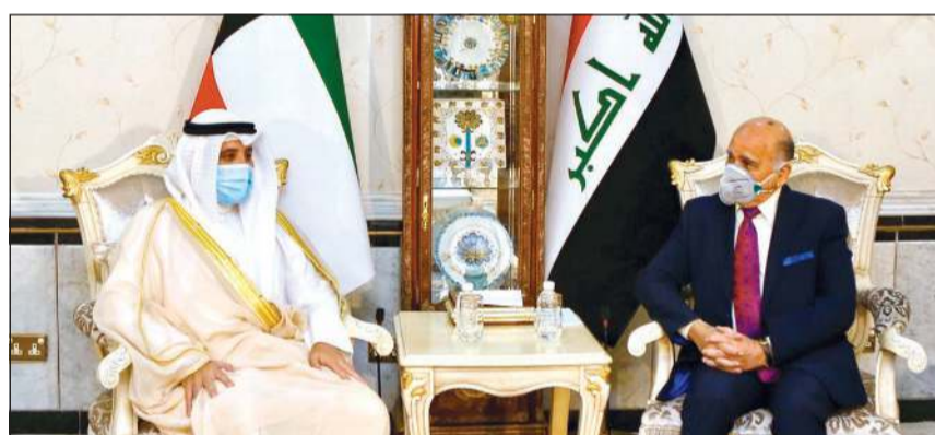
مبعوث صاحب السمو الأمير الشيخ صباح الأحمد وزير الخارجية الشيخ د. أحمد ناصر المحمد خلال لقائه مع وزير خارجية العراق فؤاد محمد بكي

التقى مبعوث صاحب السمو الأمير الشيخ صباح الأحمد، وزير الخارجية الشيخ د. أحمد ناصر المحمد، رئيس مجلس النواب بجمهورية العراق الشقيق محمد الحلبوسي بمناسبة الزيارة الرسمية التي يقوم بها والوفد المرافق للعاصمة العراقية بغداد. وتم خلال الاجتماع استعراض اواصر العلاقات الوثيقة والمميزة التي تربط البلدين والشعبين الشقيقين وبحث سبل تعزيز وتطوير التعاون المشترك فيما بينهما على كل الأصعدة وفي مختلف المجالات بما يصب في صالح البلدين وشعبهما الشقيقين.