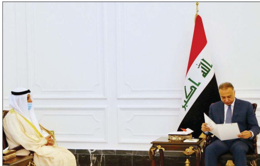
مبعوث صاحب السمو يسلم رئيس الوزراء العراقي رسالة صاحب السمو

وأكد وزير الخارجية الشيخ د. أحمد ناصر المحمد أن العلاقة بين العراق والكويت ضاربة في جذور التاريخ، وأن صاحب السمو مهتم بتطوير العلاقات الثنائية بين البلدين في السراء والضراء، وضرورة تجنب الأزمات القادمة مشاكل الماضي والحاضر. وبين أن معالجة الأزمة الاقتصادية تتم عبر ثلاثة مستويات، هي التحرك على المستوى الدولي ومع المؤسسات الدولية والحلفاء المشتركين في مجال التعاون التنموي والاستثماري، وأيضا التحرك على المستوى الإقليمي عبر التعاون مع مجلس التعاون الخليجي، حيث يمكن استثماره من خلال الربط الكهربائي وغيرها من المجالات.