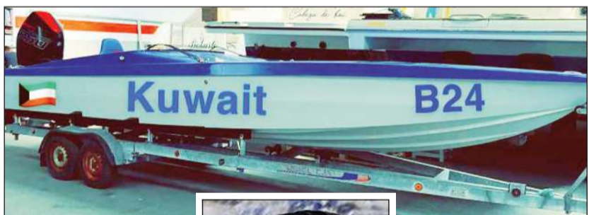
الزورق الجديد كويت B24