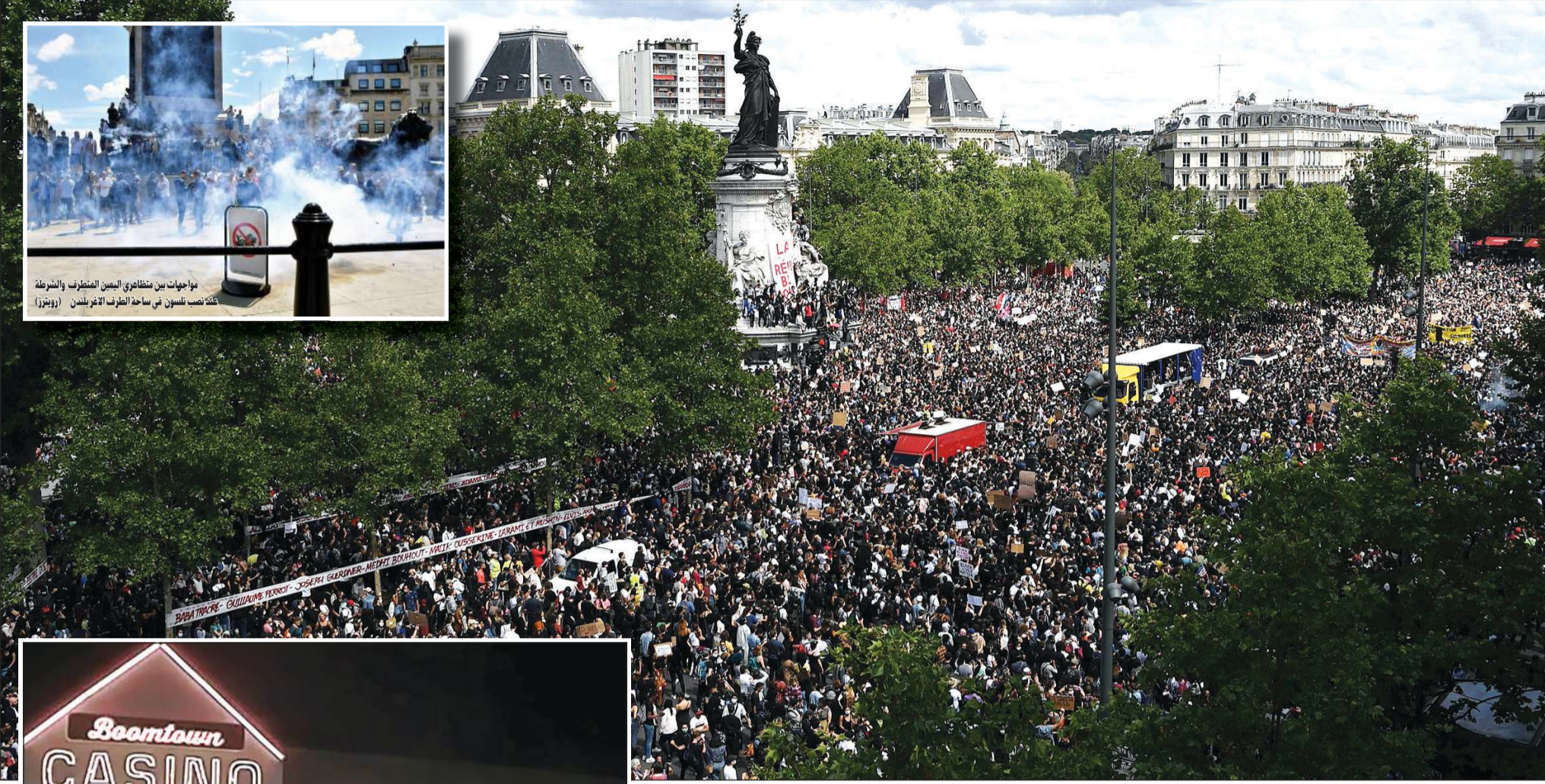
آلاف الفرنسيين يشاركون في مظاهرات مؤيدة لحركة حياة السود تهم، أمام قصر الجمهورية في باريس

عواصم - وكالات: يبدو أن العالم بعد وفاة جورج فلويد الأميركي من أصول أفريقية خفقا تحت رغبة شرطي أبيض، لن يعود كما كان قبله. فقد تجددت الاحتجاجات التي أطلق شرارتها الفيديو المصور للحادثة للأسبوع الثالث امس في عدة دول غربية. إذ شارك الآلاف في أنحاء أستراليا في احتجاجات مؤيدة لحركة «حياة السود مهمة» مع مراعاتهم وضع الكمامات والحفاظ على قواعد التباعد الاجتماعي وسط مناشدات من زعماء الدولة بإلغاء الحدث خشية حدوث موجة ثانية من العدوى بفيروس كورونا. وكانت المظاهرات سلمية في مجملها لكنها شهدت حضورا مكثفا للشرطة. وسار محتجون في الشوارع وتجمع آخرون في متنزهات عامة ورفعوا لافتات كتب عليها «لا عدالة، لا سلام» و«ناسف للازعاج، نحاول تغيير العالم».