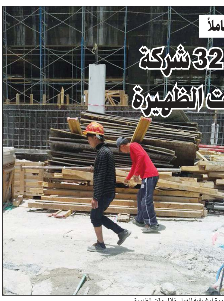
صورة أرشيفية للعمل خلال وقت الظهيرة