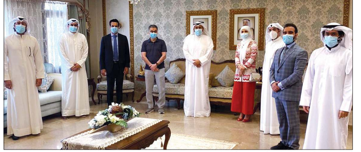
الشيخ د. باسل الصباح خلال استقباله وفد جمعية الجراحين