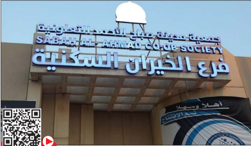
فرع «الخيران السكنية» الجديد