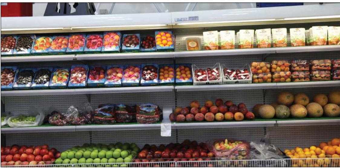
الخضار والفاكهة متوفرة في فرع «الخيران السكنية» التعاونية

الجديد هو لخدمة أهالي الخيران السكنية وتوفير الأصناف المتنوعة لهم، واصفا الفرع الجديد بأنه امتداد لمساهمي مدينة صباح الأحمد السكنية ونجاح مجلس الإدارة في نبه ثقة الجهات المعنية، خصوصا وزارة الشؤون الاجتماعية والعمل في تقديم الخدمات للمناطق المجاورة لمدينة صباح الأحمد السكنية. وذكر أن مجلس الإدارة والأعضاء والجهاز التنفيذي