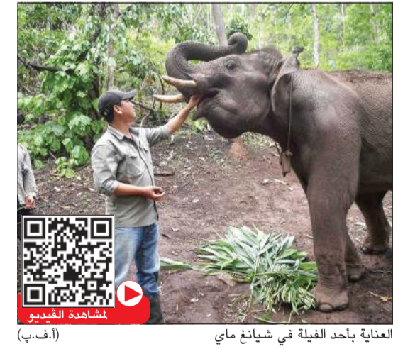
العناية بأحد الفيلة في شيانغ ماي (أ.ف.ب)

هواي باكوت - (أ.ف.ب): هرب نحو ألف فيل مهدد بالجوع من مخيمها هجرها السياح في تايلند وعادت إلى مسقط رأسها، في موجة هجرة غير مسبوقة محفوفة بخطر كبير على هذه الحيوانات. تعتبر هواي باكوت في شمال تايلند موطناً لبعض هذه الحيوانات، وقد روضت أجيال متعاقبة من مربي الفيلة أو الماهوت، هذه الثدييات الضخمة مدة 4 قرون. وعلى مسافة 180 كيلومترا في المركز السياحي شيانغ ماي، تدر تربية الفيلة على الماهوت إيرادات كثيرة، إذ تؤدي تلك الحيوانات الضخمة حيلاً مختلفة أمام السياح في المنتزهات أو ما يطلق عليها «ملاذات». وتستخدم بعض تلك المنشآت المثيرة للجدل أساليب وحشية لتدريب الفيلة إذ يكسب أصحابها رزقهم من خلال إجبارها على تقديم عروض ترفيهية لحافل السياح الذين يتوقون إلى عيش هذه التجربة الفريدة. لكن العودة إلى الديار لا تخلو من المشكلات. تضم هواي باكوت عادة أقل من 10 فيلة. أما اليوم، فيعيش فيها أكثر من 90 فيلا إلى جانب 400 قروي. وفيما تنام بعض الأفيال في الغناء الخلفي للمنازل، تبقى معظمها في الغابة ليلا بحراسة مربيها. لكن في بعض الأحيان، تهرب وتتجول حول مزارع خاصة ما يزيد من خطر تعرضها للذئب من قبل الأشخاص الذين يحاولون الدفاع عن محاصيلهم. وأوضح ثيرابات أنه تم تسجيل مواجهات بين الفيلة وأصيب اثنان منها على الأقل خلال القتال.