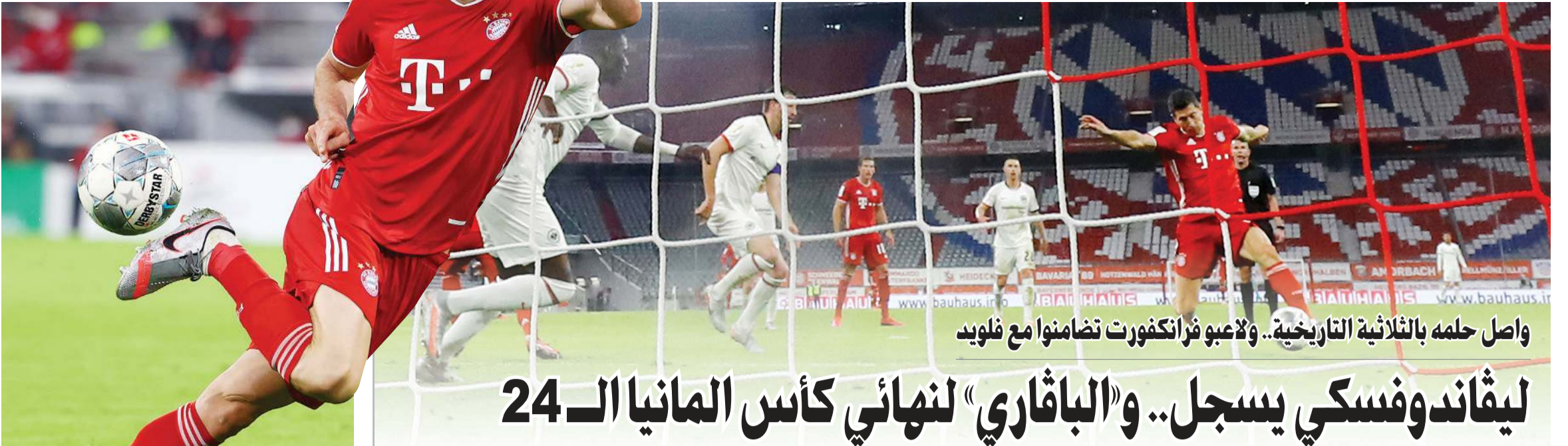
واصل حلمه بالثلاثية التاريخية.. ولاعبو فرانكفورت تضامنوا مع فلويد