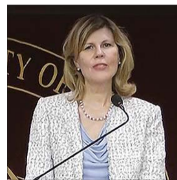
رئيسة الجامعة د. روضة عواد متحديّة

نظمت الجامعة الأمريكية في الكويت حفل تكريم افتراضي لطلابها المتفوقين الحاصلين على تقديرات عالية خلال الفصل الدراسي الأول لخريف 2019، والذين تم إدراج أسمائهم على قائمة رئيس الجامعة وقائمة عمداء الكليات بالجامعة للاحتفال بإنجازاتهم في مختلف الفئات وحظي الحفل الإلكتروني بمشاهدة كبيرة وتقدير كبير من مجتمع الجامعة والجمهور. وخلال كلمتها أثنّت د. روضة عواد على المتفوقين وإنجازاتهم الأكاديمية ثم قامت بتقديم أسماء الطلاب المتفوقين من مختلف الكليات تباعاً، وتم منح 45 طالباً شهادة التميز ضمن قائمة رئيس الجامعة وهو تمييز يمنح لأولئك الذين حافظوا على معدل تراكمي 4.0، للفصل الدراسي الأول لعام 2019-2020 في حين حصل 108 طالباً على شهادة التميز ضمن قائمته على شهادة التميز ضمن قائمته عمداء الكليات - وهو تمييز يمنح للطلاب الذين حافظوا على معدل تراكمي 4.0، وهو تمييز يمنح لأولئك الذين حافظوا على معدل تراكمي لا يقل عن 3.7، وفيما يلي أسماء الطلبة المتميزين: