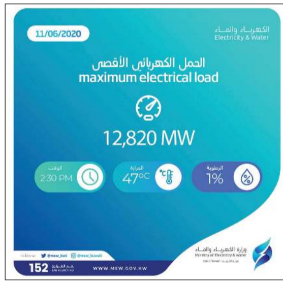
المؤشر الكهربائي كما بدأ أمس

توقعت مصادر مطلعة في وزارة الكهرباء والماء استمرار ارتفاع معدل الاستهلاك اليومي للكهرباء في ظل ارتفاع درجات الحرارة. وقالت المصادر ان الوزارة تتحضر لبدء المرحلة الثانية من عودة الحياة والتي ستشهد عودة الجهات الحكومية للعمل وإعادة فتح عدد من الأنشطة والمجمعات، ما سيرافقه ارتفاع ملحوظ بمعدلات الاستهلاك عما نراه اليوم، وقد بلغ مؤشر الأعمال أمس 12820 ميغاواط مواصلاً ارتفاعه عن الأيام السابقة، علماً ان الاستهلاك الأعلى المتوقع لدى الوزارة يصل