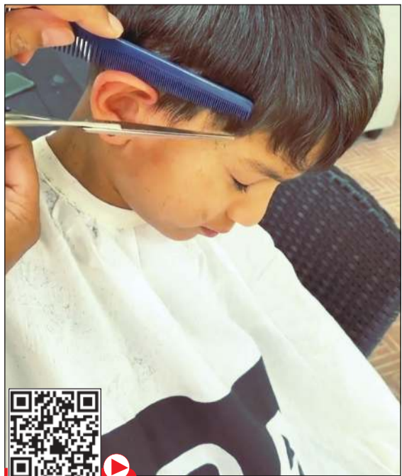
نهي نبيل تحلق لابنها بالمنزل

ووافقتها الرأي أم إيمان قائلة: مستحيل أزد لزيارة