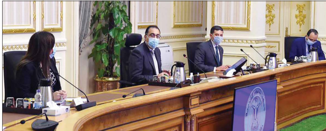
رئيس الوزراء مصطفى مدبولي يواصل لقاءاته مع المستثمرين لجذب استثمارات جديدة

والسماح للمطاعم بأن تفتح أبوابها أمام الجمهور، ولكن مع التشديد على الالتزام بتطبيق الإجراءات الاحترازية والقائية. وقال د.مصطفى مدبولي «اعتباراً من منتصف يونيو سنعمل على دراسة إقامة بعض الشعائر في دور العبادة، لكننا سنأخذ بعض الوقت لإتمام ذلك، من حيث دراسة الآليات والتوقيت الملائم والإجراءات التي يمكن أن تتخذ، بحيث تضمن سلامة المواطنين». السى ذلك، واصل رئيس مجلس الوزراء، لقاءه بعدد من المستثمرين، في نقاش مفتوح، حول أوضاع الاستثمار في هذه المرحلة