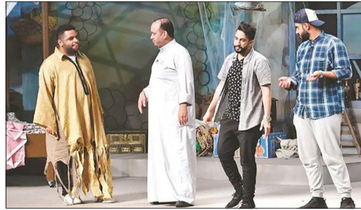
البناي في مشهد من مسرحية «ليلة رزقه»