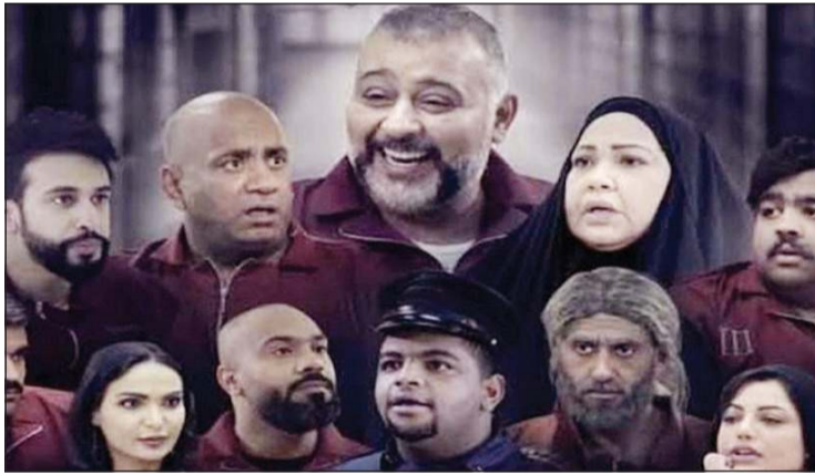
تجوم مسلسل «السجن»

أخيرا، ما انعكاس أزمة كورونا عليك بشكل خاص؟ ● أنا أمثل على المسرح منذ عام 2007 اي منذ 13 عاما، وغيايبي انا وباقي «القروب» عنه شيء محزن لنا جميعا، لأننا تعودنا كل عام يعايد جمهورنا من على خشبة المسرح من خلال أعمالنا، وربما يكون ذلك «خبرة» من رب العالمين بأن تكون وسط أهلنا وأولادنا، وأنا أؤكد لك ان هذه الفترة اعطتنا طاقة خيالية لتكون عودتنا الفنية قوية ولها تأثير إيجابي كبير.