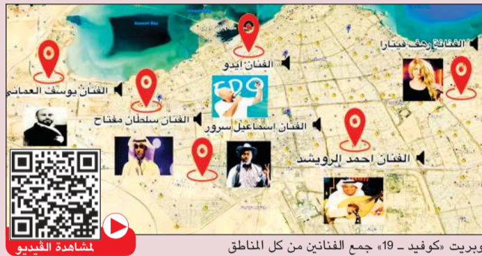
أوبريت «كوفيد-19» جمع الفنانين من كل المناطق