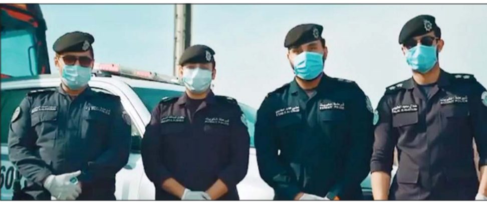
مشهد من أغنية «وتستمر الحياة»

عبر الفنان العماني القدير طالب البلوشي عن سعادته بإقامة مهرجان «سينيما» للفيلم العربي» عبر المنصة الالكترونية والذي ينظمه الاتحاد العام للفنانين العرب من خلال فرعه بسلطنة عمان. وأضاف في تصريح صحفي: من الأمور المهمة حاليا استمرار الفن السابع رغم كل الظروف التي يمر بها العالم بعد انتشار وباء كورونا (كوفيد - 19) المستجد، فرغم كل ذلك هناك شغل سواء بواسطة المؤسسات أو الأفراد في صناعة الإبداع مع صف الدفاع الأول الذين يستحقون من يظهر عطاءهم وتضحياتهم وهذا المهرجان يمشي مع كل معطيات الظرف وأنا كفنان وسينمائي يشرفني انه تم اختياري لأشارك الأمانة في لجنة التحكيم لهذه الصورة البصرية الإبداعية في هذه الحادثة التاريخية، فشكرا لاتحاد الفنانين العرب رئيسا ونوابا وأعضاء لانهم يجتوبون أن الفن السابع