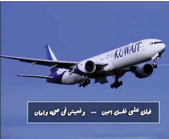
فلن على نفس أمين ... ونعيش في صحة وأمان

كشفت الفنانة نرمين الفقي عن أسباب عدم زواجها وارتباطها حتى الآن رغم أنها تعد فتاة أحلام الكثيرين، وقالت إن عروض الزواج التي عرضت عليها لم تكن مناسبة لها، وأنه كان يصادف إما أن يكون العريس لا تراه زوجها مستقبليا أو تحب شخصا ولا تتسنى لهما الظروف كي يتزوجا، أو تحب شخصا لا يبادلها الشعور. وكشفت الفقي، في تصريحات تلفزيونية، عن مواصفات فتى أحلامها وقالت: «عايزة بني آدم يكون محترم، ولديه وظيفة محترمة، وأن يكون عنده ثقة في نفسه، وثقة في المرأة التي يحبها»، لافتة إلى أن وراء كل امرأة ناجحة زوجا محبا ويتمنى لها النجاح، وهذا يدل على ثقته بنفسه. وأشار إلى أن آخر مشاركات نرمين الفقي في حكاية «ما يطلبه المستمعون» ضمن حكايات الجزء الثالث من مسلسل «نصيبتي وقسمتك»، وشاركها في البطولة رانيا محمود ياسين وإيهاب فهمي ومحمد عادل، والمسلسل من تأليف عمرو محمود ياسين وإخراج أكرم فريد.