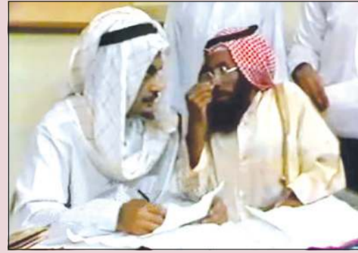
الراحل عبدالحسين عبدالرضا في أوبريت «يوميات صائم»