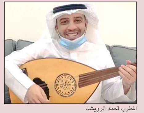
المطرب احمد الرويشد