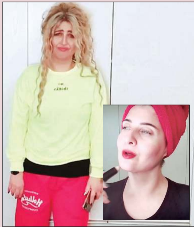
المطربة ريف في الأوبريت