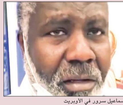
اسماعيل سرور في الأوبريت