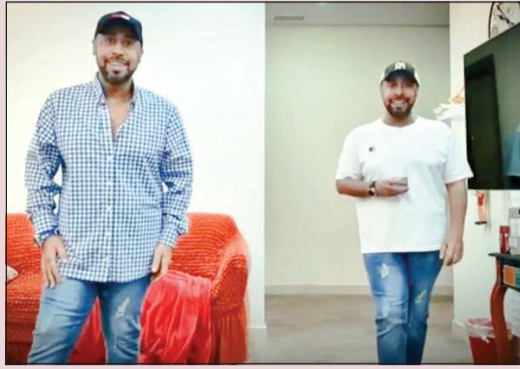
مشاركة مميزة من النجم يوسف العماني