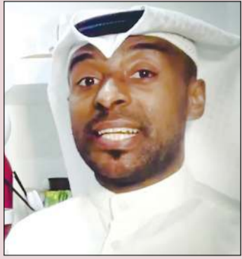
سلطان المفتاح في الأوبريت