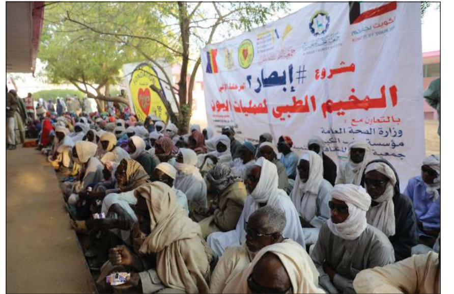
جانب من المستفيدين من مخيمات «إبصار»

وتابع: تبلغ تكلفة العملية الجراحية للمريض 40 دينارا، من خلال هذا المبلغ البسيط تتقل حياة إنسان من العجز والمرض والظلام والتعب النفسي والبدني له ولأسرته وذويه إلى النور والعمل والإنتاج والعطاء والكفاح، داعيا للتواصل مع جمعية النجاة الخيرية ودعم مخيمات علاج مرضى العيون من خلال حساب @alnajatorg أو من خلال الاتصال على مركز الاتصال 1800082.