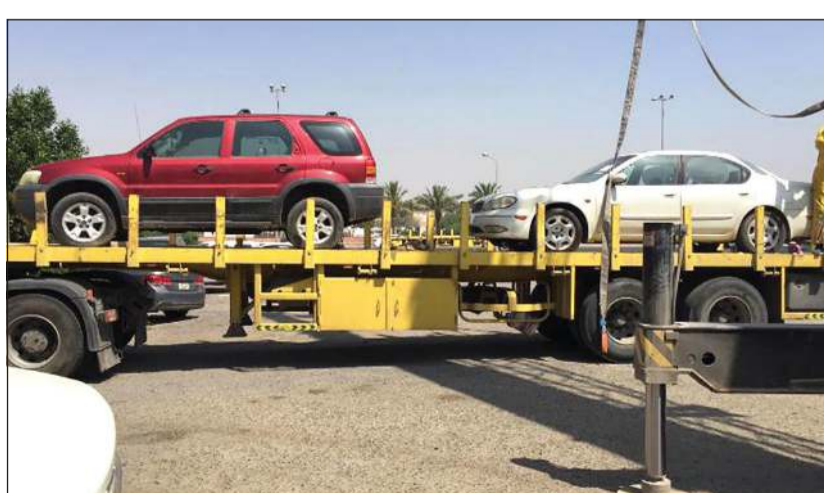
رفع سيارات مهمة

النطاق بمناطق المحافظة للناكس من مستوى النظافة بالمناطق عمليّة غسيل وتعقيم الحاويات، مشيرة إلى أن الجولات الميدانية أسفرت عن غلق محل هواتف وغسيل وتعقيم 10820 حاوية مختلفة الأحجام وسلالاً متحركة فضلاً عن رفع 8 سيارات مهمة بعد انتهاء الفترة القانونية لوضع ملصق الإنذار والإفراج عن 4 سيارات إلى جانب نقل 6 دروب أنقاض و12 دربا من الخلفات من طريق الوفرة.