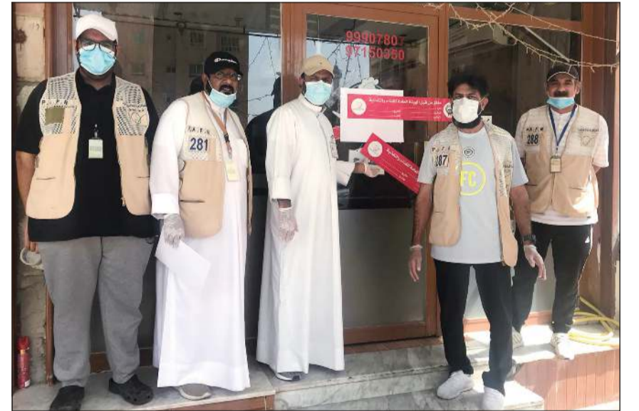
إغلاق أحد المطاعم