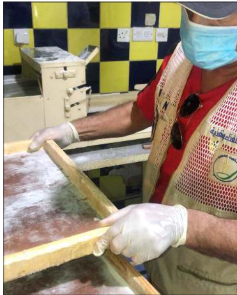
مراقبة أحد المخازن

وأضاف في تصريحات لـ «الأنباء»: إننا مستمرون في الحاسية ومخالفة جميع المنشآت الغذائية غير الملتزمة بالاشتراطات،