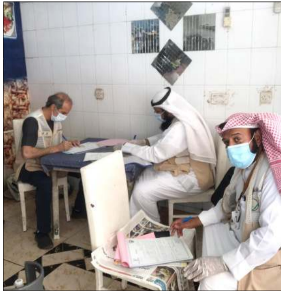
تحرير مخالفة خلال الجولة