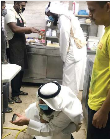
التأكد من النظافة في المطعم