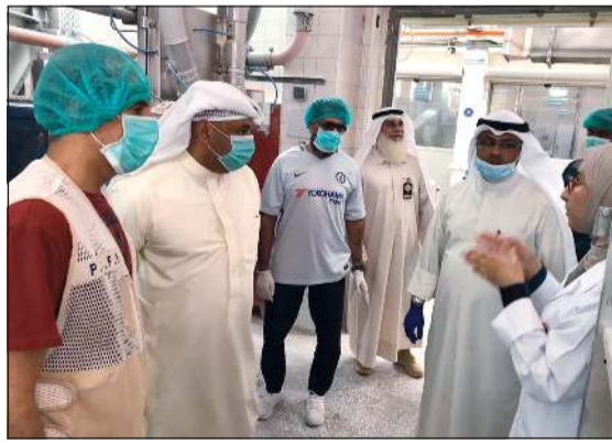
جانب من الجولة

حيث نعمل ضمن الاختصاصات الأصلية للهيئة وفق قانون إنشائها رقم 112 لسنة 2013 والقانون المعدل رقم 16 لسنة 2019، والذي تنفرد به الهيئة والمتضمن التفتيش والرقابة على المنشآت الغذائية وترخيصها وترخيص العاملين فيها، والتأكد من سلامة المادة الغذائية ومطابقتها للمواصفات والإشراطات الصحية. ودعا الكندري إلى الحصول على المعلومة من مصادرها المعنية والتحقق من الأخبار الواردة، مؤكداً أن ما تم تداوله في وسائل التواصل عن إغلاق مطعم مخالف للاشتراطات الصحية وسلامة المادة الغذائية من قبل إحدى الجهات الحكومية أمر عار عن الصحة.