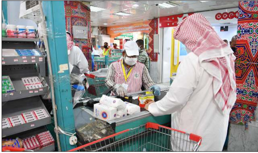
الزمام تام من موظفي تعاونية الجليب بالاشتراطات الطبية والصحية (قاسم باشا)

تكليف اتحاد الجمعيات الخيرية بتوزيع السلال الغذائية ضمن تطبيق الاشتراطات الصحية