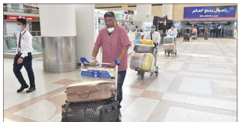
مغادرون في طريقهم إلى الجوازات