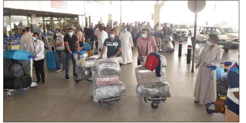
عدد من المسافرين المصريين أمام المطار

علمت «الانباء» من مصادر مسؤولة في مطار الكويت الدولي عن قيام الإدارة العامة للطيران المدني بالاستعانة ببوابات لتعقيم المسافرين المغادرين على متن الرحلات من خلال التعقيم بالبخار المعتمد والموصى به من وزارة الصحة، مضيفاً أن تلك البوابات باستطاعتها قياس درجة حرارة الشخص من خلال نظام استشعاري متطور إضافة إلى تعقيمه لمدة 15 ثانية قبل الصعود إلى الطائرة. وأضافت المصادر أن الباب الإلكتروني يستطيع تعقيم ما يقارب 1500 راكب، وهو الحد الأقصى لسعة البخار المتواجد خلالها، كما أن البوابة الواحدة تستطيع الاحتفاظ ببيانات 20 ألف مسافر وهي السعة التخزينية الأكبر لها. وحول إتمام تلك العملية، أكدت المصادر أنها ستكون جاهزة بشكل كامل قبل فتح الرحلات التجارية والمنتظر الإعلان عنها من قبل مجلس الوزراء، حيث لن يستطيع الراكب الصعود إلى الطائرة سوى عبر تلك البوابات.