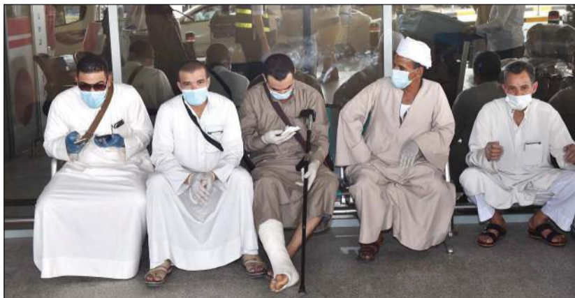
في انتظار انتهاء الإجراءات