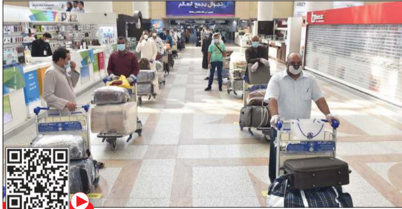
تطبيق مبدأ التباعد الجسدي خلال إنهاء إجراءات السفر

فيما غادر 1645 راكبا من جنسيات مختلفة إلى عدد من الدول، حيث غادر 270 مسافراً إلى أصفهان في الجمهورية الإسلامية الإيرانية ورحلة إلى تيروشيربالي إلى الهند وتحمل 130 راكبا، ورحلة إلى أيفاتو (مدغشقر) ولبيلونفوي (مالاوي) وتحمل 334 راكبا، بالإضافة إلى