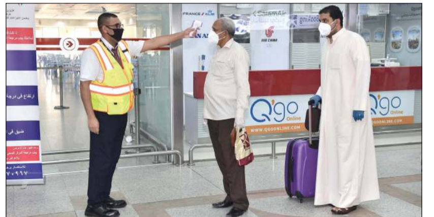
قياس الحرارة للمسافرين