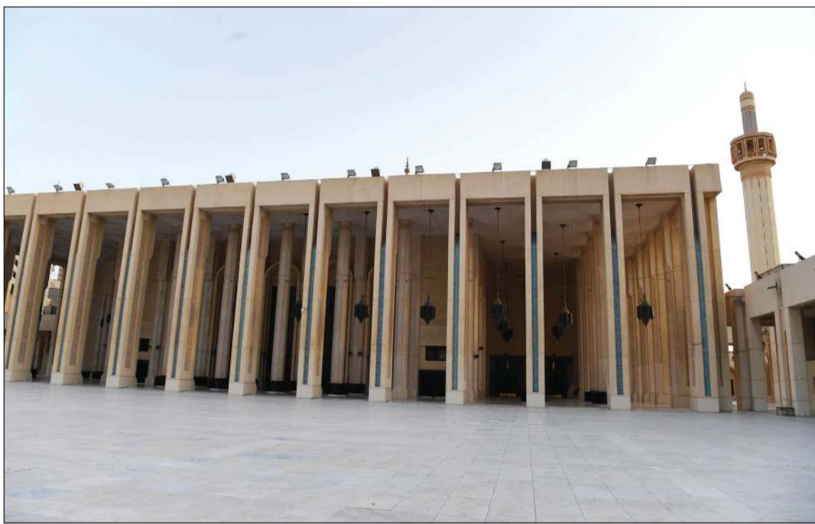
فتح المساجد مؤشر نحو العودة للحياة الطبيعية

بقرارات الحكومة وأهم شيء هو افتتاح المساجد بيوت رب العالمين وإن شاء الله الأمور طيبة وشوي شوي تحل بالدنيا سهلات»، مضيفاً أن الحكومة «ما قصرت وسوت