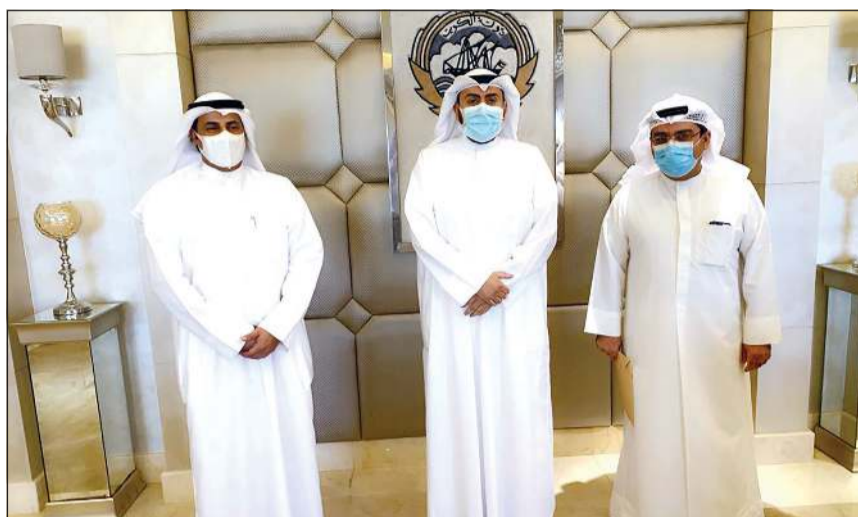
الشيخ د.باسل الصباح و د.مصطفى رضا وبندر العنزي

التقى رئيس جمعية التمريض بندر نشمي العنزي وزير الصحة الشيخ د.باسل الصباح ووكيل الوزارة د.مصطفى رضا لمناقشة أهم القضايا التي تخص مهنة «التمريض». وأعرب رئيس مجلس إدارة جمعية التمريض الكويتية بندر نشمي العنزي في تصريح صحافي عقب اللقاء عن تفهم الوزير لمطالب الهيئة التمريرية ودورها الحيوي والرئيسي في المنظومة الصحية. وأفاد العنزي بتطرق اللقاء إلى مناقشة توفير سبل الحماية للطواقم التمريضية، مؤكداً شديد حرص الوزير ووكيل الوزارة على توفير كل سبل الوقاية والحماية لجميع الكوادر الطبية من أطباء وهيئة تمريضية وفنيين وجميع العاملين في المرافق الصحية في مواجهة جائحة «كورونا». وفيما جدد العنزي التأكيد على عدم تلقي الجمعية أي شكاوى من الهيئة التمريرية، أشار إلى أن كل القضايا التي تهم الهيئة التمريرية في جميع المناطق والمرافق الصحية تلقى كل الدعم والتأييد من قبل وزير الصحة ووكيل الوزارة.