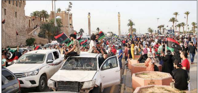
احتفالات بعد سيطرة قوات الوفاق على العاصمة طرابلس