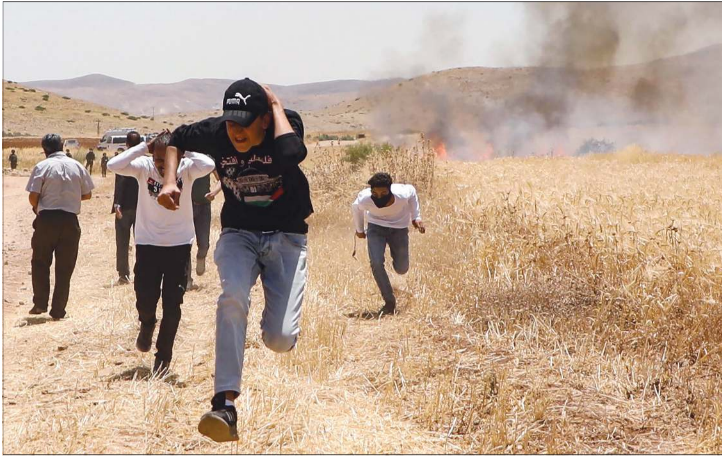
فلسطينيون يحتمون من قنابل الغاز التي يطلقها الاحتلال تجاههم خلال احتجاجات على ضم الضفة في بلدة العطف في غور الأردن

جرانهم، فضلا عن العمل مع دول المجتمع الدولي من أجل ردع الضم، وتنفيذ قرارات القيادة في التأكيد على أن الشعب الفلسطيني في حل من الاتفاقيات التي اغتالها إسرائيل والولايات المتحدة، وتعزيز الجبهة الدولية من أجل إنهاء الاحتلال الإسرائيلي الذي طال أمده منذ النكسة في عام 1967. وفي المناسبة نفسها، قال صائب عريقات أمين سر اللجنة التنفيذية لمنظمة التحرير الفلسطينية امس، إن تاريخ الاحتلال الاستعماري الطويل للضفة الغربية وقطاع غزة بما فيها القدس الشرقية، يجب أن يشكل حافزا للمجتمع الدولي لترجمة مواقفه الراضية لمخططات الضم الإسرائيلية غير القانونية، إلى إجراءات وخطوات عملية ولموسسة تبدأ بمسائلته والاعتراف بدولة فلسطين. وشدد عريقات، في بيان أوردته «وفا»، على أن استمرار الاحتلال وترسيخه يوما إثر آخر هو مسؤولية قانونية وسامسية وأخلاقية تقع على عاتق المجتمع الدولي، الذي يواجه خيارا واحدا، إما تتكهن شعبنا من ممارسة حقه في تقرير المصير، أو إبقاء المنطقة أسيرة لدوامه القوضي والعنف. وأضاف عريقات أنه «على