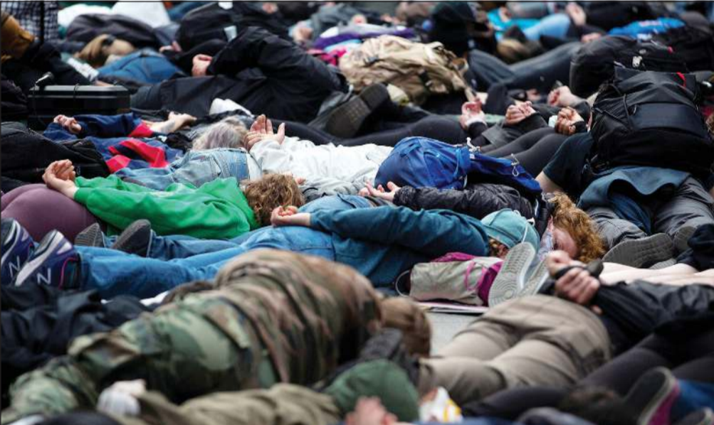
أميركيون منبسطون على الأرض لتجسيد الوضعية الأخيرة لجورج فلويد قبل أن يخنقه الشرطي خلال مظاهرة في سياتل