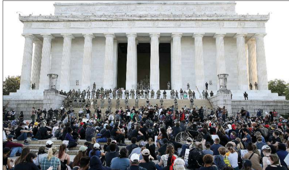
عناصر من الحرس الوطني يحرسون نصب لينكولن التذكاري حيث تجمعت حشود من الأميركيين للتبديد بعنف الشرطة

وكالات: رغم فرض حظر التجول ورغم تهديدات الرئيس الأميركي دونالد ترامب باللجوء إلى الجيش لإعادة الأمور إلى نصابها، تواصلت الاحتجاجات والتظاهرات ضد العنصرية وعنف الشرطة في الولايات المتحدة، ويبدو أن نسبة تأييد تلك الاحتجاجات أخذت في التزايد بين الأميركيين الناخبين على طريقة تعامل ترامب معها. بحسب استطلاعات الرأي. وبعد تسعة أيام على مقتل الأميركي من أصول أفريقية جورج فلويد اختناقاً تحت ركبة شرطي أبيض، ارتفعت حصيلة معتقلي احتجاجات «لا استطيع التنفس»، على يد الشرطة الأميركية إلى أكثر من 9300 شخص بجمع أنحاء البلاد، وفقاً لإحصاءات «أسوشيتد برس».