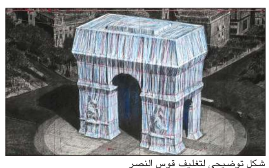
شكل توضيحي لتغليف قوس النصر

باريس - أ.ف.ب: أكد مركز النصب الوطنية في فرنسا أن مشروع الفنان كريستو الذي توفي الأحد، بتغليف قوس النصر في باريس بالقماش لا يزال مقررًا في خريف العام 2021. وقال المركز، الذي يدير قوس النصر وهو من أكثر معالم باريس استقطابا للزوار، أن المشروع «يتواصل وفقا لأمنيات الفنان». وكان المشروع مقررًا في الأساس في سبتمبر 2020 لكنه أرجئ إلى الفترة نفسها من 2021 بسبب جائحة «كوفيد-19»، وسيقام من 18 سبتمبر إلى الثالث من أكتوبر 2021. وغرد رئيس المركز فيليب بيلفال بعد وفاة الفنان البلغاري الأصل «سنحصر على تنفيذ هذا المشروع لتعدي إلى هذا الفنان بعضا من الحب الذي كان يكنه لباريس». وأوضحت لور مارتان المشرفة على مشروع «تغليف قوس النصر»، «كانت هذه أمنية كريستو حتى وفاة زوجته جان-كلود في 2009، أن ينفذ المشروع حتى لو توفي قبل ذلك». وتوفي كريستو الأحد في نيويورك عن 84 عاما وهو اشتهر بتغليف معالم عالمية شهيرة بالقماش من بينها جسر بون نوف في باريس ومبنى رايشتاغ في برلين.