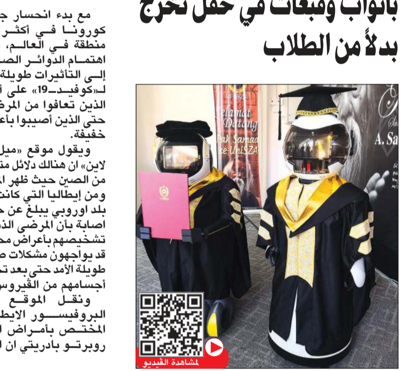
الروبوتان سباع ونسيم يتحضرن للحفل