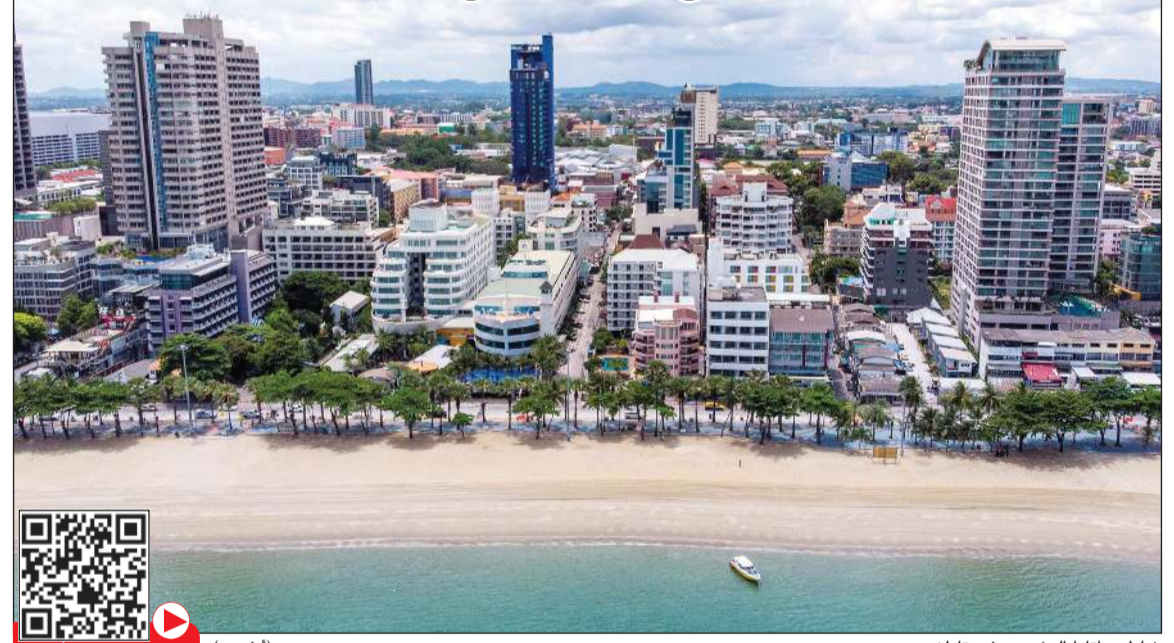
شاطئ باتايا الرئيسي في تايلند