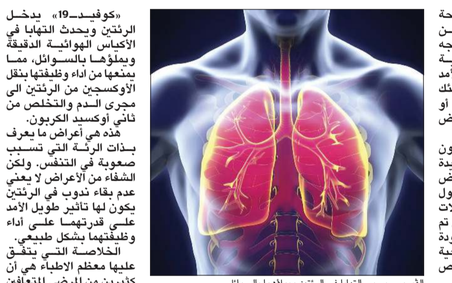
الفيروس يسبب التهابا في الرئتين ويملأهما بالسوائل لإعادة تأهيلهما واستعادة المريض لأسلوب حياته السابق.