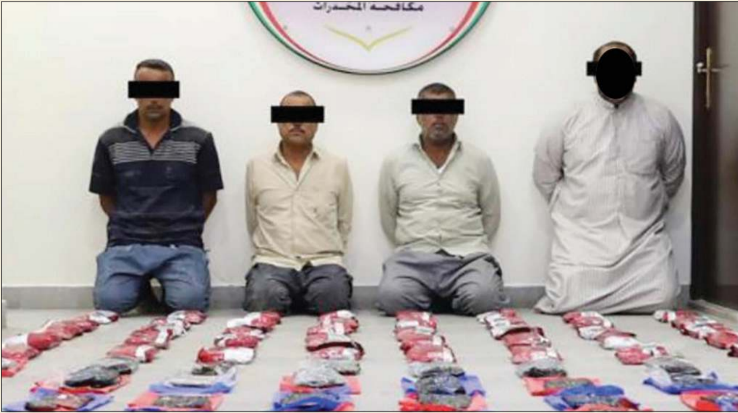
العراقيون الثلاثة وتاجر كيف البدون من أصول عراقية والمضبوطات في عهدة الأمن الجنائي

الضبطية تعتبر من أضخم الكميات المهربة في العام الحالي 2020 وتتميز بضبط التاجر والمهربين الثلاثة بجريمة التلبس المشهودة