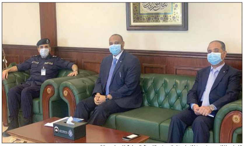
اللواء طلال معرفي خلال استقبال وفد اللجنة الدولية للصليب الأحمر

في البلاد لمنع انتشار فيروس كورونا المستجد، وأكد اللواء طلال معرفي أن وزارة الداخلية لا تالو جهدا في تقديم خدماتها لنزلاء المؤسسات الإصلاحية سواء الإنسانية أو الصحية، وقد تم وضع خطط للسيطرة على الوضع الصحي داخل السجن المركزي في ظل الظروف الراهنة. وأشاد وفد الصليب الأحمر الدولي بما تقدمه الكويت من برامج وتطبيقات إصلاحية وتأهيلية وصحية لنزلاء المؤسسة الإصلاحية وتأمين المناخ الاجتماعي والنفسي داخل السجون بما يعزز سياسة التأهيل.