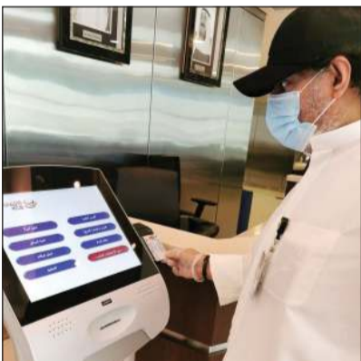
المصنف يتأكد من عمل الأجهزة

وبمناسبة قرب عودة العمل التدريجية واعداد واعتماد خطة العمل التدريجية المعدة من قبل بنك الائتمان تقدمت الإدارة التنفيذية للبنك بالشكر والتقدير والثناء للمكوكبة الشبكية العاملة في بنك الائتمان الكويتي طيلة فترة تعطيل الأعمال بالدولة أثناء جائحة كورونا الذين أبوا بلاء حسنا في القيام بأعمال البنك بكل مهنية منعا لأي تعطيل أو تاخير، والتي منها تقديم دفعات القروض للعملاء إلكترونيا «ONLINE»، إضافة للأعمال المساندة المالية والإدارية.