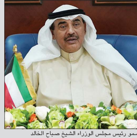
سمو رئيس مجلس الوزراء الشيخ صباح الخالد