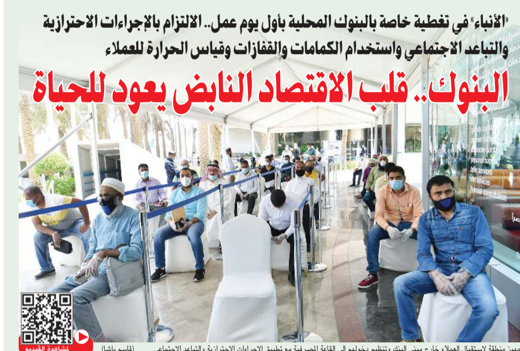
تجهيز منقطة استقبال العملاء خارج مبنى البنك وتنظيم دخولهم الى القاعة المصرفية مع تطبيق الاجراءات الاحترازية والتباعد الاجتماعي (قاسم باشا)