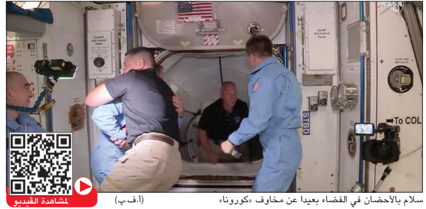
سلام بالأحضان في الفضاء بعيدا عن مخاوف «كورونا»

واشنطن - أ.ف.ب: دخل رائدا مركبة «كرو دراغون» التابعة لـ «سبايس إكس» بوب بنكن وداغ هيرلي محطة الفضاء الدولية الأحد، ليصبحا أول شخصين يصلان إلى المحطة على متن مركبة تملكها شركة خاصة. وفتح المر عند الساعة 1,02 بتوقيت المنطقة الشرقية في الولايات المتحدة (17,02 ت غ)، ليحبر بعد نحو عشرين دقيقة الرائدان إلى المحطة بعد استكمال الإجراءات التقنية. وكان بنكن أول الداخلين إلى المحطة مرتديا قميصا أسود وسروالا باللون الكاكي، ولحق به هيرلي. واستقبلهما زميلهما الأميركي كريس كاسيدي الذي كان موجودا في المحطة مع الرائدتين الروسيين أناتولي إيفانيشين وإيفان فاغتر.