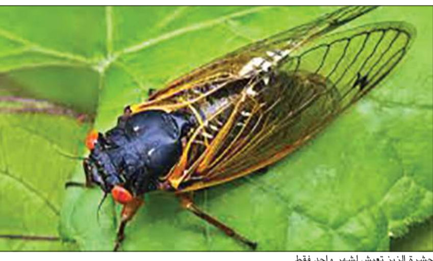
حشرة الزين تعيش لشهر واحد فقط

2003 و2004 و2013 ومن المفترض أن تخرج الزين المعمرة المعروفة في IX brood من تحت الأرض في سنة 2021 ولكن شاء القدر أن تقدم خروجها في سنة 2020. عامل وراثي وقالت الحربي إن العلماء يعتقدون أن ربما كان هناك عامل وراثي أحدث تغييرا في وقت خروج الزين قبل 2021 إلى جانب الاحتباس الحراري، وتعتبر درجة حرارة الأرض التي تزيد عن 18 درجة سيليزية هي العامل الأساسي لخروجها إلى سطح الأرض، لافتة إلى اتفاق علماء الحشرات في جامعة كورنيل وواشنطن على أن الدافع الأساسي من وراء اختفائها هو عدم رغبتها في ألا يتزامن وجودها مع انتشار المفترسات خاصة الطيور والضفادع. وأضافت: أنتشرت المخاوف من تلك الحشرة عبر منصات التواصل الاجتماعي والصحف في الوقت الذي مازال العالم يعاني من الفيروس التاجي، ولذا نشير إلى أن حشرة الزين غير مؤذية للإنسان إلا إذا تواجدت قريبا منها فقد تخطف ذراع شخص أو أي جزء آخر من جسمه على أنه ساق نبات فتسبب الحساسية للبعض. وظهرها بهذه الطريقة الجماعية المخيفة ظاهرة طبيعية متكررة.