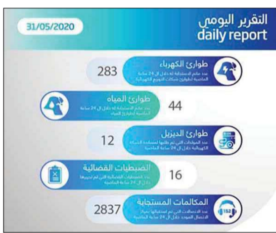
التقرير اليومي للاستجابة مع البلاغات