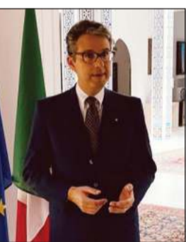
السفير الإيطالي كارلو بالدوتشي

البيضة التي اتخذتها السلطات الكويتية للحد من انتشار فيروس «كوفيد-19» والوقاية منه ومواجهة أي حالة طارئة، بالإضافة إلى الإضاءة الكبيرة بمختلف مظاهر التضامن العديدة والمهمة التي تلقتها السفارة من الحكومة الكويتية ومن الشعب الكويتي الصديق. وافتتح الاحتفال فعلياً بعزف خاص للشعب الوطني الإيطالي، من تقديم أكاديمية كيجانا «Accademia Chigiana»، التي أطلقت موسماً موسيقياً مهماً في الأشهر الماضية بالتعاون مع السفارة الإيطالية.