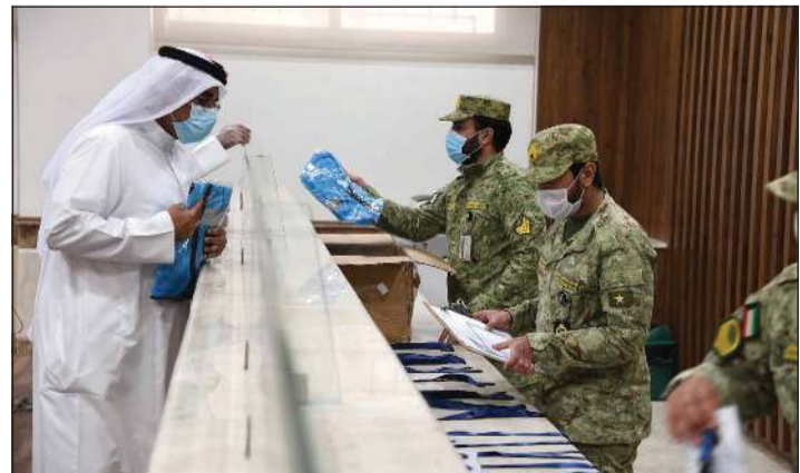
استقبال أحد المتطوعين

الوطني يهتم وتقديرها لمبادرتهم التي تنم عن نواياهم الصادقة في خدمة وطنهم يمثل هذه الظروف من جانبهم، أعرب عدد من المتطوعين عن سعادتهم بالتطوع والانضمام إلى اخوانهم بالحرس الوطني لخدمة الوطن والمساعدة في تجاوز الكويت الغالية أزمة فيروس (كورونا) بكل تبعاتها.