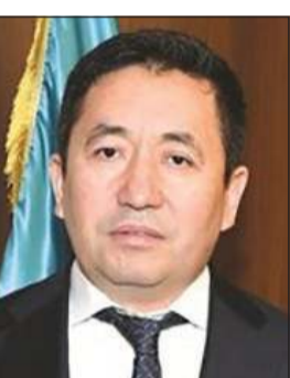
سفير كازاخستان دولت ميميردييف

وتوقع انتصار الكويت ومختلف دول العالم على فيروس كورونا المستجد COVID-19 في القريب العاجل وستعود الحياة إلى مجاريها الطبيعية. ولفت إلى أن بلاده كازاخستان أيضاً تتحول تدريجياً إلى الحياة الطبيعية، وبمرور الوقت سيتم افتتاح المطار الدولي وستستأنف الرحلات الجوية الدولية وستتم استعادة زيارة كازاخستان دون تأشيرة مع دول أخرى، بما في ذلك الكويت