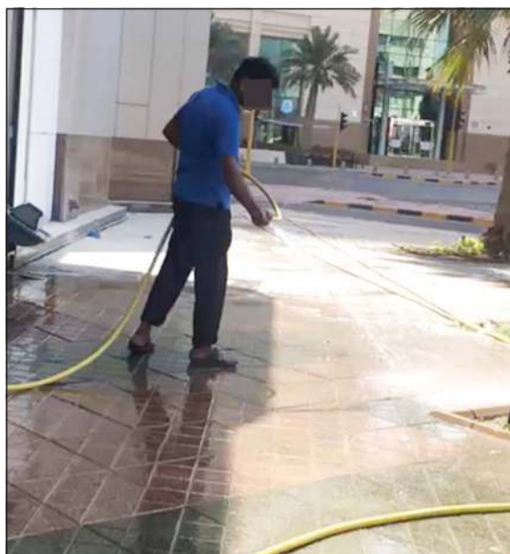
هدر المياه يترتب عليه إجراءات قانونية