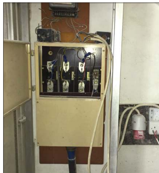
العيب بالعدادات من المخالفات الجسيمة