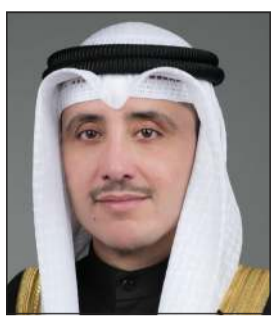
الشيخ د. أحمد ناصر المحمد

أجرى وزير الخارجية الشيخ د. أحمد ناصر المحمد اتصالاً هاتفياً مع وزير خارجية جمهورية نيبال الديمقراطية الاتحادية الصديقة برايدب جوالي، تناول خلاله موضوع ترحيل العمالة النيبالية المخالفة لقانون الإقامة والمقيمة بصورة غير قانونية في الكويت إلى وطنهم. وذكرت وزارة الخارجية في بيان صحفي أنه تم أيضاً بحث مجمل العلاقات الثنائية التي تربط البلدين الصديقين وأطر تعزيز التعاون المشترك نحو مواجهة تداعيات جائحة فيروس كورونا المستجد (كوفيد-19).