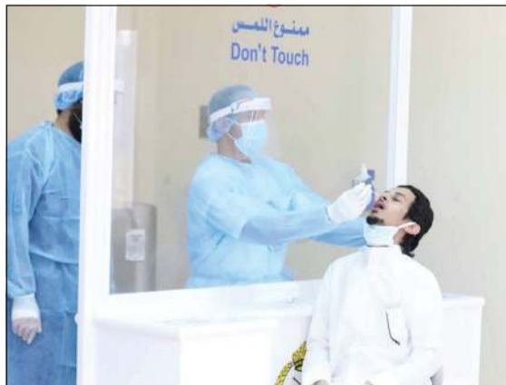
فحص أحد المتطوعين