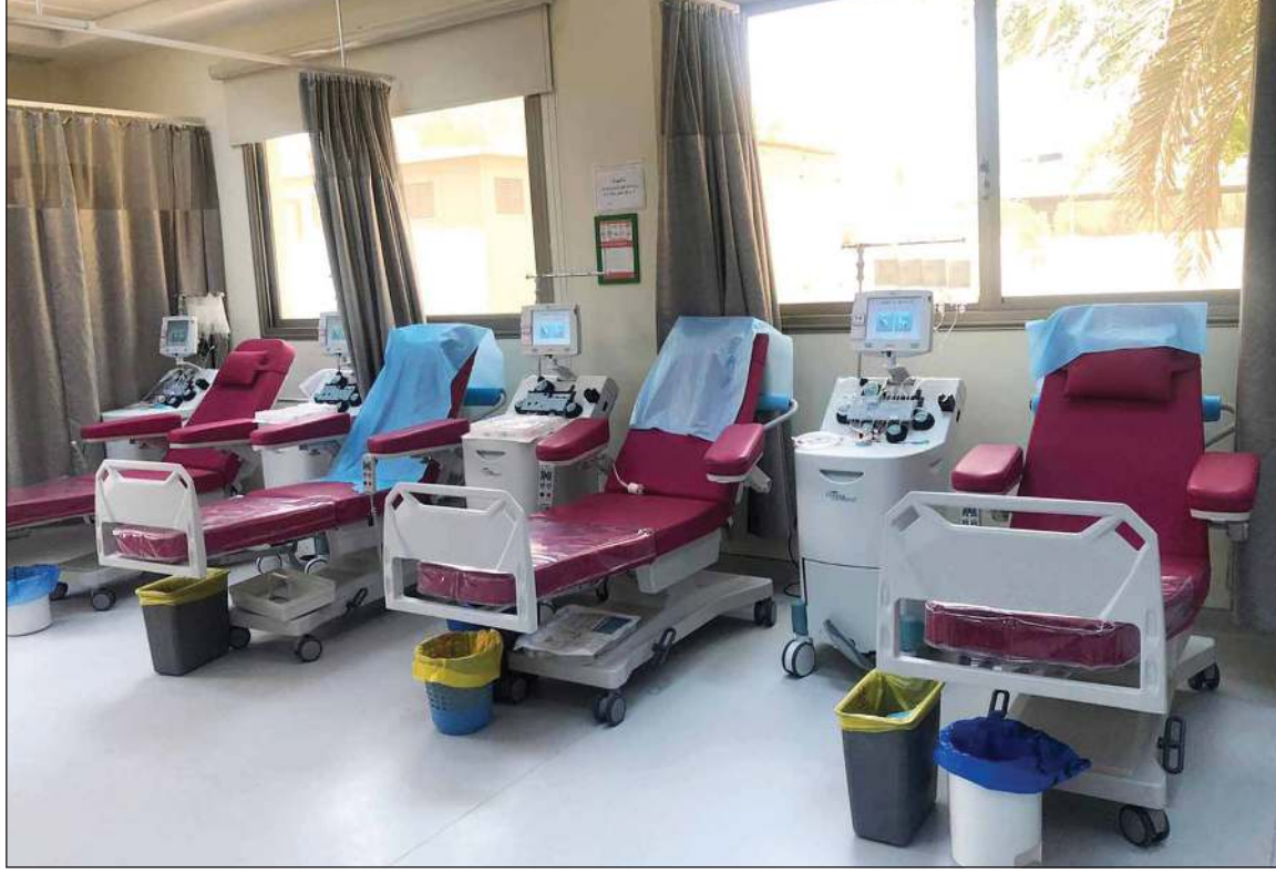
وحدة مستقلة للتبرع بالبلازما

■ 4 أسرة مجهزة لاستخلاص البلازما في وحدة مستقلة ببنك الدم.. وتجميع 350 وحدة علاجية ونقل 46 إلى مرضى «كوفيد-19»