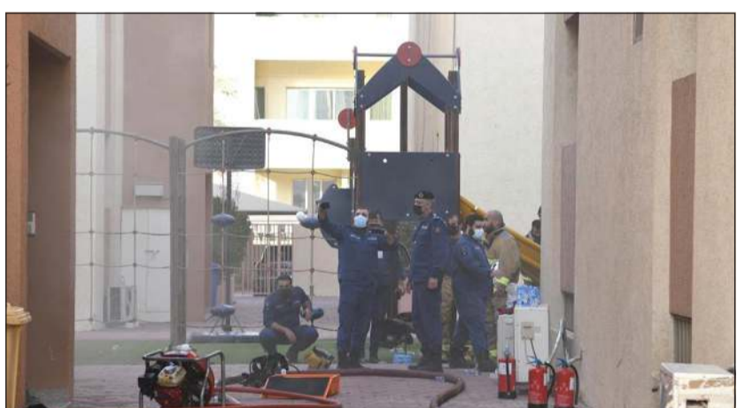
عدد من رجال الإطفاء أثناء معاينة موقع الحريق