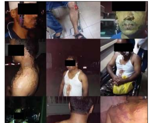
عدد من المجني عليهم

منذ مطلع 2020، وبحسب مصدر أمني، فإنه وفور انتشار تقرير إخباري عن عصابة الابتزاز تلك تم تكليف الإدارة العامة للمباحث الجنائية بضبط أعضاء هذا التشكيل العصابي، وجرى توقيف السوري وشريكه البنغالي، وأكد المصدر أن أياً من المجني عليهم لم يتقدموا بتسجيل قضايا لأسباب متنوعة من بينها أن عدداً منهم مخالف لقانون الإقامة وأخريين تعرضوا للتهديد بالقتل إذا ما أبلغوا «الداخلية».