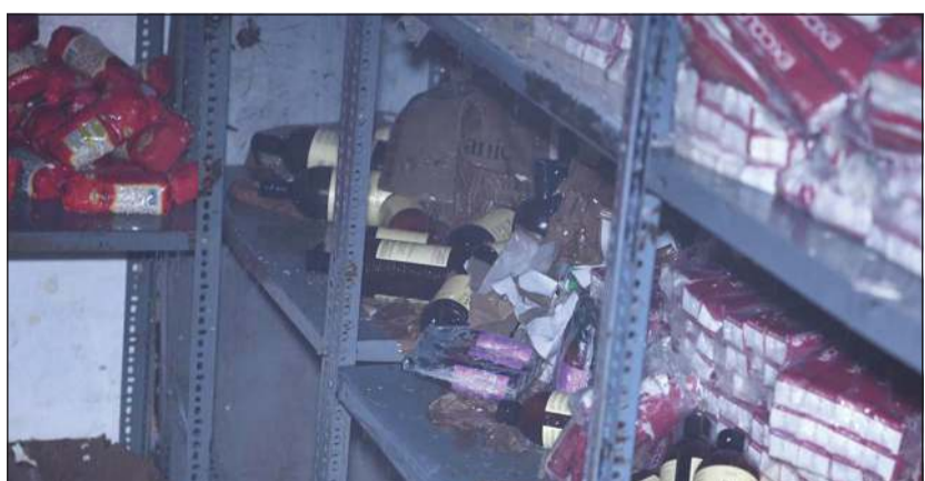
السرداب الذي اندلع فيه الحريق مخصص لتخزين أدوات التجميل