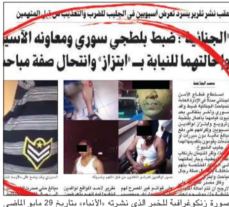
السوري زعيم التشكيل العصابي قبل ضبطه