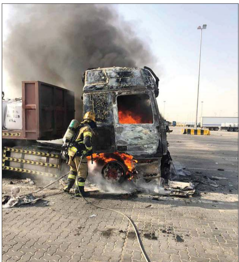
رجل إطفاء يتعامل مع حريق الشاحنة

الحريق في الغالب ناتج عن تماس كهربائي. وبحسب بيان للإطفاء، فقد هرع صباح أمس رجال إطفاء مركز النويصيب إلى منفذ النويصيب الحدودي للتعامل مع حريق شاحنة وتمت السيطرة عليه دون وقوع أي إصابات بشرية.