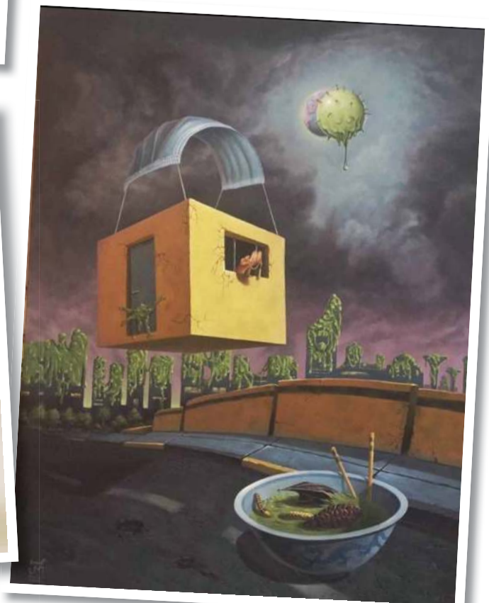
«الابتلاء» زيت على كانفوس «نواف الحملي»