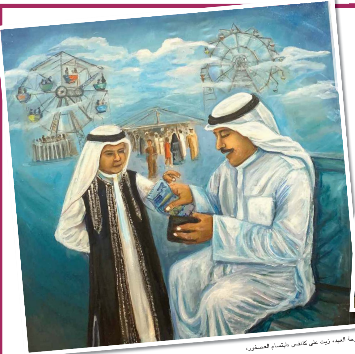
«فرحة العيد» زيت على كانفوس «ابتسام العصفور»