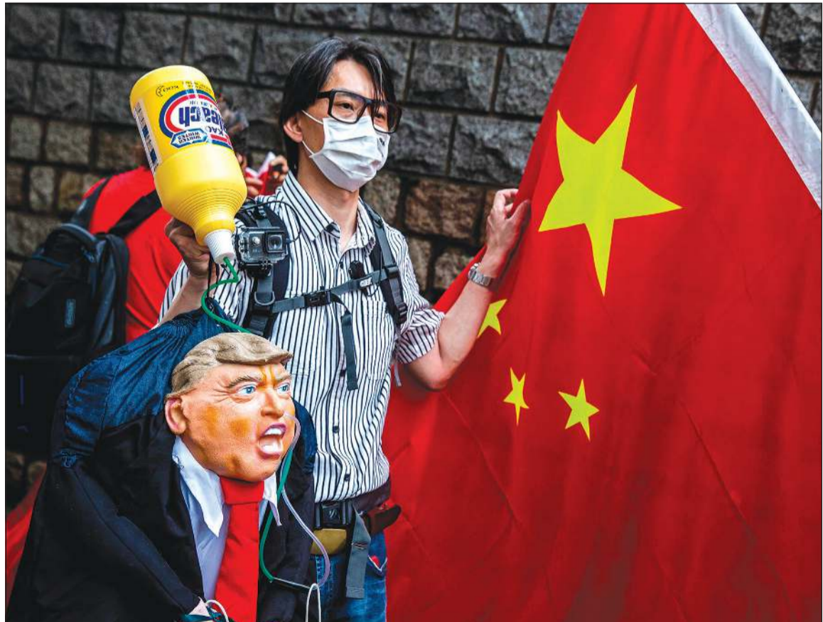
متظاهرون يحملون صورة الرئيس دونالد ترامب خلال احتجاج خارج القنصلية الأميركية في هونغ كونغ

وقال حازم قاسم الناطق باسم حركة المقاومة الإسلامية (حماس) «إن إعدام جيش الاحتلال لمواطن فلسطيني من ذوي الاحتياجات الخاصة، يؤكد إجماع قادة الاحتلال وساديتهم».