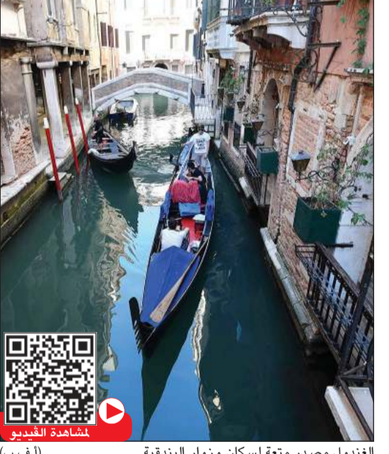
الغندول مصدر متعة لسكان وزوار البندقية

فكل تلك الأحوال توقف عن العمل كلياً أو جزئياً منذ فرض حظر شامل خلال أزمة فيروس كورونا المستجد. وقال روبرتو دي روسي أحد الحرفيين التقليديين القائلين الذين يبنون القوارب السوداء الطويلة «البندقية بدون هذه القوارب قائمة ولا معنى لها». ويصنع هذا النجار الذي يبلغ من العمر 58 عاماً 4 إلى 5 قوارب غندول سنوياً، يستغرق إنجاز كل واحد منها حوالي 400 ساعة. ويبلغ طول القارب أكثر من 10 أمتار وعرضه 1,38 متر ووزن 600 كيلوغرام، ويتألف من 280 قطعة من الخشب من 8 أنواع مختلفة من الأشجار من بينها البلوط والأرز والجرز والكزب والزيتون والأرز. ويتم شراء هذه القوارب حصرياً من قبل سائقي الغندول الذين يدفعون 30 إلى 50 ألف يورو.