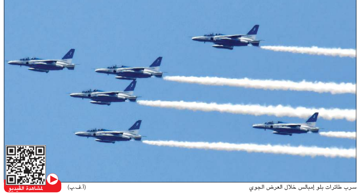
سرب طائرات بلو إمبالس خلال العرض الجوي

طوكيو - وكالات: نفذت طائرات فريق الطيران الجهواني التابع لسلاح الجو الياباني عروضاً في سماء طوكيو لتحية الطواقم الطبية التي تصدق لفيروس كورونا المستجد. فقد حلق سرب بلو إمبالس للعرض الجوية التابع للقوات الجوية اليابانية فوق وسط طوكيو الجمعة لتحية الأطقم الطبية العاملة على الخطوط الأمامية لمكافحة الفيروس. وأثناء مرور تشكيل مؤلف من ست طائرات من طراز تي-4 في السماء الزرقاء الصافية بعد منتصف النهار بقليل، لوح الأطباء وأطقم التمريض