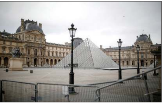
متحف اللوفر عانى طويلاً من الإغلاق

باريس - رويترز: قال متحف اللوفر في باريس أمس الجمعة إنه يعتزم إعادة فتح أبوابه في السادس من يوليو بعد الخطوات التي أعلنها رئيس الوزراء إدوار فيليب أمس الخميس لتخفيف قيود العزل العام المفروض بسبب فيروس كورونا. وقال المتحف الذي يزوره أكبر عدد من الجمهور في فرنسا في بيان إنه يتعين على الزائرين حجز تذكرة قبل السماح لهم بالدخول، وأن يتبعوا لافتات إرشادية في الداخل كما طلب منهم استعمال الكمامات وتطبيق قواعد التباعد الاجتماعي تحقيقاً للمحد الأقصى من الأوضاع الأمنية» عندما يأتون إلى مبانيه.