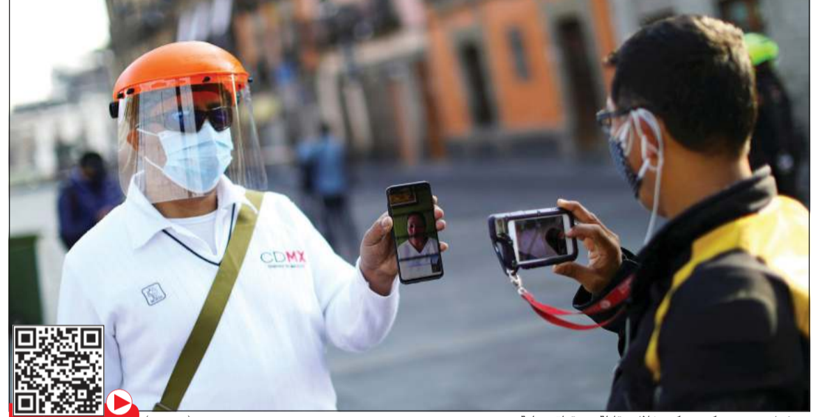
مسؤول صحي مكسيكي خلال مقابلة مع قناة محلية

توستلا غوتيزيرز (المكسيك) - أ.ف.ب: تعرض مبنى بلدية ومنشآت أخرى لهجوم الخميس خلال موجة من العنف في قرية يعيش فيها سكان أصليون في المكسيك، بعد انتشار شائعات مرتبطة بفيروس كورونا المستجد على موقع فيسبوك، وفقاً للسلطات المحلية. وقال حاكم ولاية تشياباس (جنوب) روتيليو إسكاندون في مقطع فيديو على موقع التواصل الاجتماعي إن «نحو ثلاثين شخصاً حاولوا خداع الناس في فينوستيانو كارانزا وجعلهم يعتقدون أن وباء كوفيد-19 غير موجود». وقد بدأ الهجوم على مبنى البلدية ومبنى تجاري وثلاثة منازل عقب منشور على «فيسبوك» نقلته وسائل إعلام محلية، يؤكد